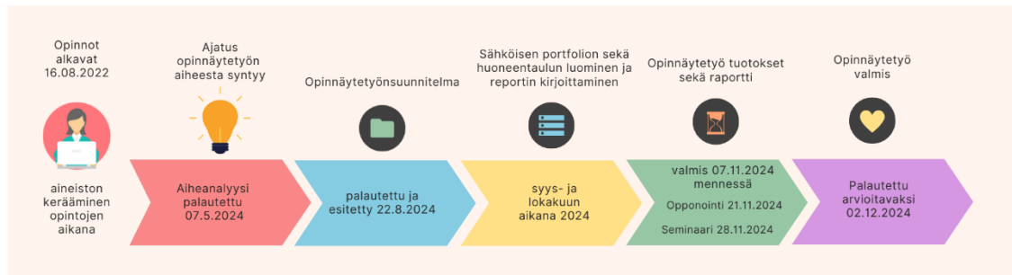
Kuvio 1: Aikajana opinnäytetyön etenemisestä

kanssa, muodostaen kokonaiskäsityksen valitusta teemasta. Infograafissa tiivistän niin omia ajatuksia kuin lähteistä nousseita asioita opintojen tuottamasta hyödystä. Aikajana prosessin etenemisestä esitän alla Kuvio 1.