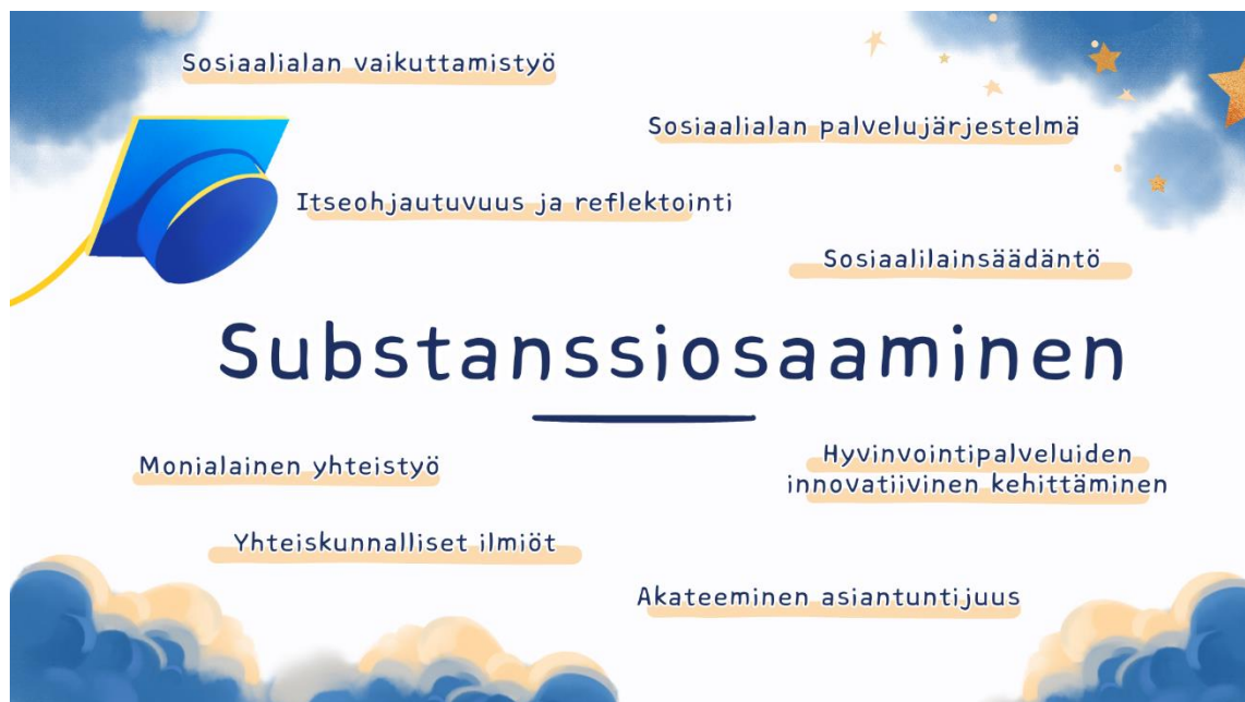
Kuvio 4: Substanssiosaamisen teemat

Sosionomin opintoihin peilaten substanssiosaaminen pitää sisällään akateemista asiantuntijuutta, monialaista yhteistyötä, hyvinvointipalveluiden innovatiivista kehittämistä, sosiaalialanlainsäädäntöä, itseohjautuvaa ja reflektointia toimintatapaa sekä sosiaalialan vaikuttamistyötä ja -palvelujärjestelmän tuntemista. Alla Kuvio 4: Substanssiosaamisen teemat.