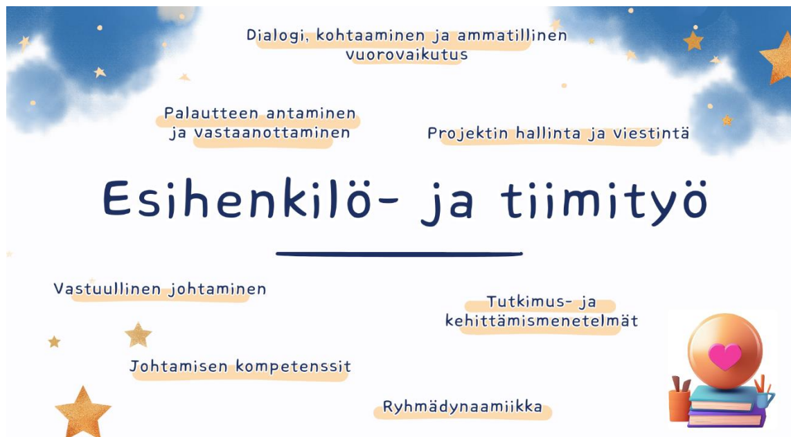
Kuvio 6: Esihenkilö- ja tiimityön teemat

Sosionomin opintoihin peilaten esihenkilö- ja tiimityötaidot pitävät sisällään vastuullisen johtamisen periaatteita sekä kompetensseja, dialogisuuden ja ryhmädynamiikan tuntemista, palautteen antamista ja vastaanottamista, projektin hallintaa ja viestintää sekä tutkimus- ja kehittämismenetelmiä. Alla Kuvio 6: Esihenkilö- ja tiimityön teemat.