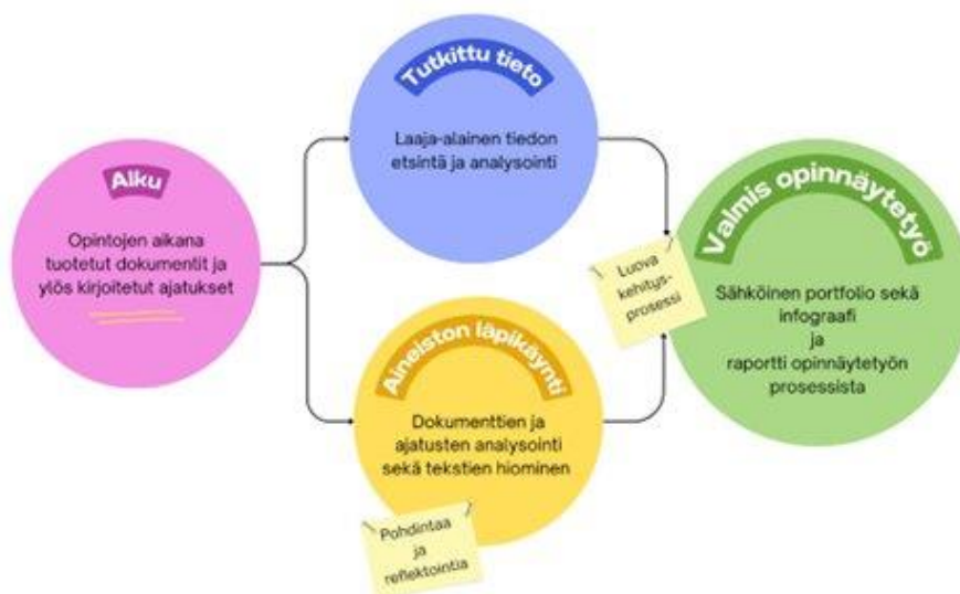
Kuvio 2: Opinnäytetyöprosessin vaiheet

Aloitin opinnäytetyön prosessin kokoamalla opintojen aikaisia tuotoksiani sekä kirjoittamiani ajatuksia ja pohdintoja sekä tiivistelmiä yhteen. Prosessi jatkui tekstien läpikäymiseen, hiomiseen, pohtimiseen ja tiivistämiseen sekä samanaikaisesti laaja-alaiseen tiedon etsimiseen aihealueittain sekä lähdeaineiston kokoamiseen. Molemmat tuotokset ovat syntyneet tämän luovan prosessin aikana. Valmis julkaistu sähköinen portfolio löytyy osoitteesta https://eu.bulbapp.com/u/sosionomi-amk-e0?sharedLink=fff5a1cf-d8ec-4883-bfc9-50ce140e5ee5 ja infograafi on opinnäytetyöraportin liitteenä. Prosessin vaiheet kuvaan alla Kuvio 2.