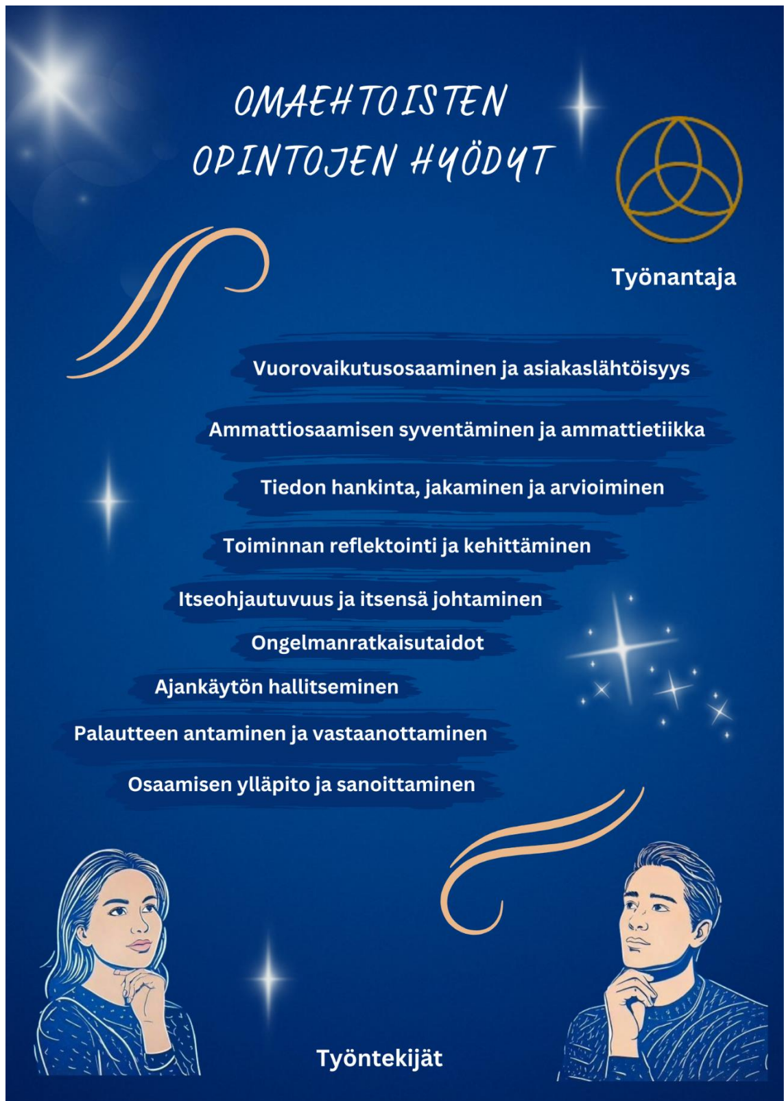
Liite 1: Infograafi omaehtoisten opintojen hyödyistä