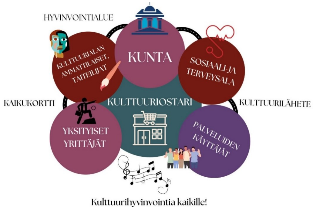
Kuva 2. Kulttuuriostari.

kuinka kulttuurihyvinvoinnin toteutuminen vaatii toimialan ylittäviä yhteistöitä. Syntyi idea kaiken yhteen kokoavasta kulttuuriostarista (kuva 2).