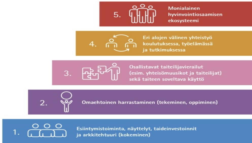
Kuva 3. Itä-Suomen Hyvinvointivoimalan kulttuurihyvinvointiporaat (Houni ym. 2020,16.)

Olemme tarkastelleet Kulttuuriostarin palvelutarjontaa Itä-Suomen Hyvinvointivoimalan luoman kulttuurihyvinvoinnin portaiden avulla (kuva 3). Portaiden tarkoituksena on havainnollistaa taiteen ja kulttuurin kokonaisvaltaisen hyvinvoinnin kaikkia eri askelmia. (Houni ym. 2020, 16.) Kulttuuriostarin tarkoituksena on kattaa portaiden neljä ensimmäistä porrasta. Saman katon alta löytyisi niin esiintymistoimintaa, näyttelyitä, harrastusmahdollisuuksia kuin taiteilijavierailuja osallistavien työpajojen merkeissä. Tavoitteena on luoda monialaista yhteistyötä ja tuoda kulttuurihyvinvoinnin vaikuttavuutta näkyvämmäksi. Houni ym. (2020, 17) täsmenävät, että viidennellä portaalla taiteen ja kulttuurin ajatellaan olevan kiinteä osa kokonaisvaltaista hyvinvointiajattelua. Viidennen portaan saavuttaminen olisi siis kulttuurihyvinvoinnin huipulle pääsyä.