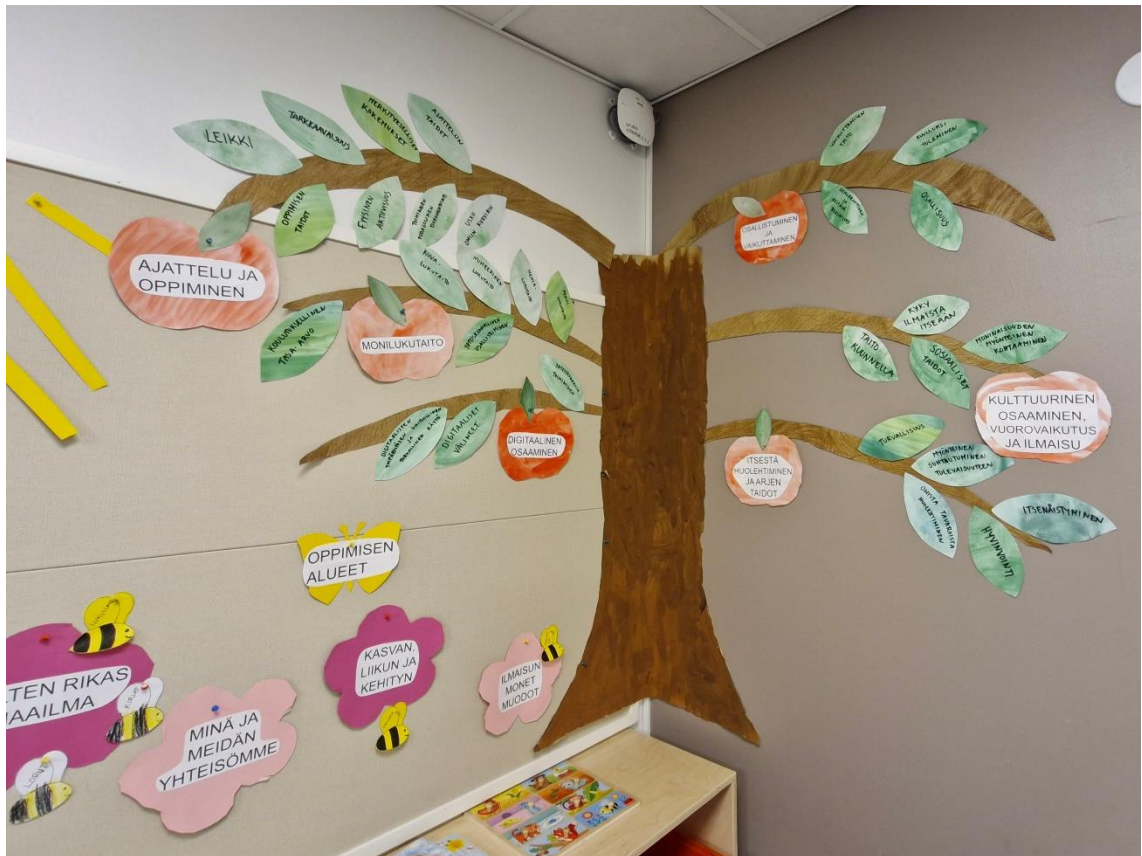
Kuva 3: Laaja-alainen osaaminen

Tänään ryhmällämme oli jumppasalivuoro ja osa lapsista oli toisen opettajan kanssa salissa. Itse olin ryhmässä osan lasten kanssa, samalla kun valmistelin vasuseinää. Tarkastelin myös yksittäisten lasten valokuvauslupia, joita on meille annettu hyvin vähän. Tämä on tietysti harmi, ettei montakaan lasta saa kuvata. Tällöin Instagramiin lisättävien valokuvien pitää sisältää jotain muuta kuin lapsia, esimerkiksi jotain mitä lapset itse ovat kuvanneet. Lasten kanssa valokuvaamista harjoitteleminen muutaman viikon päästä, kun viikon aiheena oli lasten digipedagogiikka.