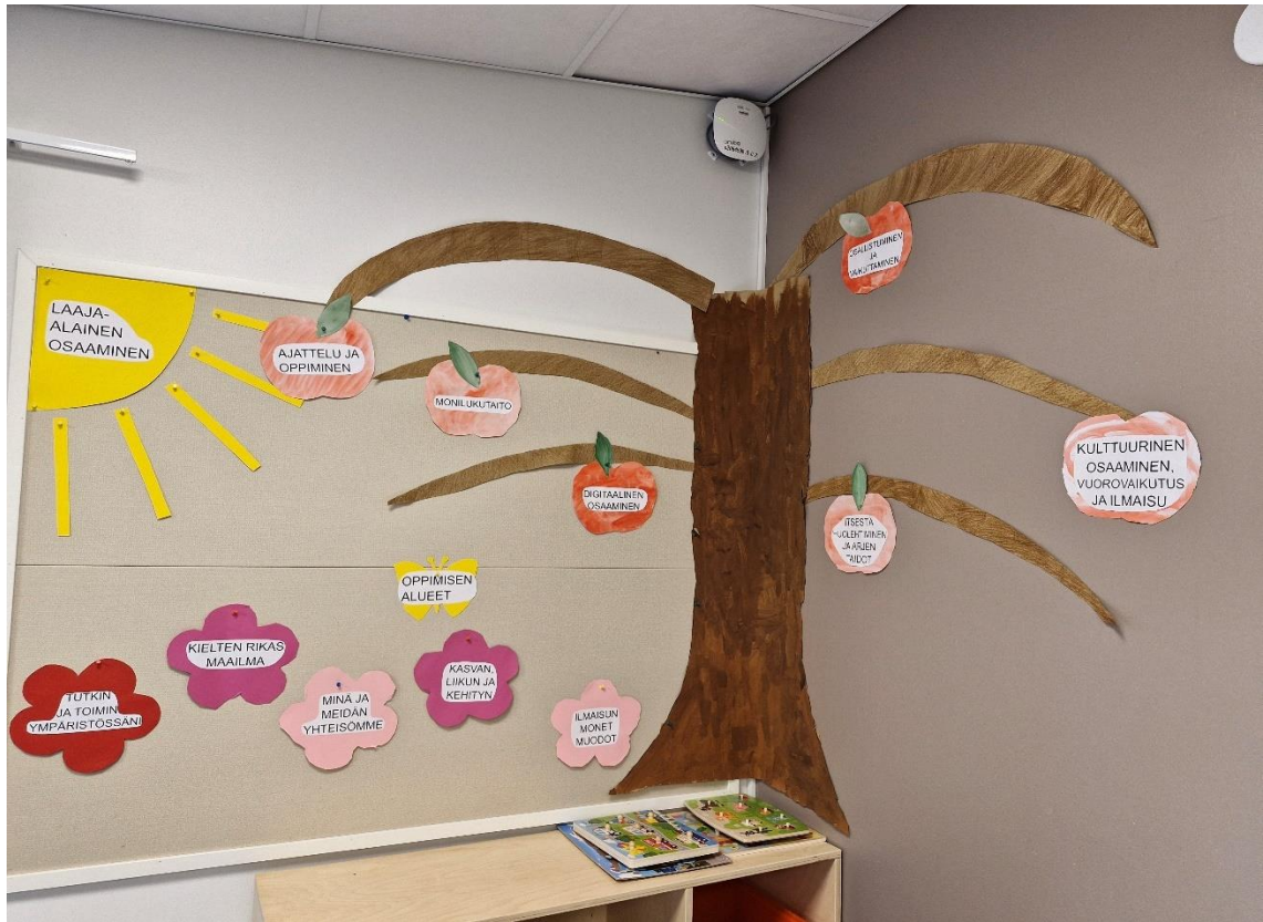
Kuva 1: Vasuseinä

valmistelin lasten avustuksella vasuseinäämme.