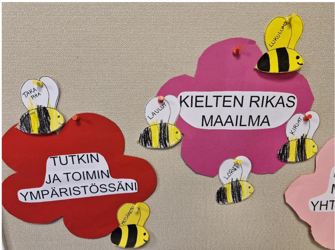
Kuva 2: Oppimisen alueet

Välipalan jälkeen ennen työvuoroni päättymistä ehdin hetken havainnoida lasten leikkimistä kotileikissä. Kotileikissä oli useampi eri ikäinen leikkijä ja osalla oli selkeä leikki yhdessä ja muutama leikki rinnakkaisleikkiä. Isommilla oli juoni leikissä ja pienemmät leikkivät vierellä omaa kotileikkiään. Isompien lasten leikki oli melko niukka sanaista, sillä kumpikaan leikkijöistä ei puhu suomea äidinkielenään, joten yhteinen kieli oli leikki ja siinä tapahtuvat asiat. Pienemmällä leikki oli vielä melko lyhyt kestoista ja välillä poikettiin tekemään jotain muuta. Kotileikki on ryhmässämme hyvin suosittua ja jouduinkin rajaamaan tilassa leikkijöitä, eli en päästänyt kaikkia halukkaita leikkimään sinne, vaan ohjasin heidät valitsemaan leikkitaulusta itselleen jonkun muun tekemisen. Leikkitaulu on sopivasti sijoitettuna kotileikkiä rajaavaan liukuoveen. Käytämme leikin valitsemiseen leikkitauluja muun muassa silloin, kun lapsen on vaikea keksiä itselleen tekemistä.