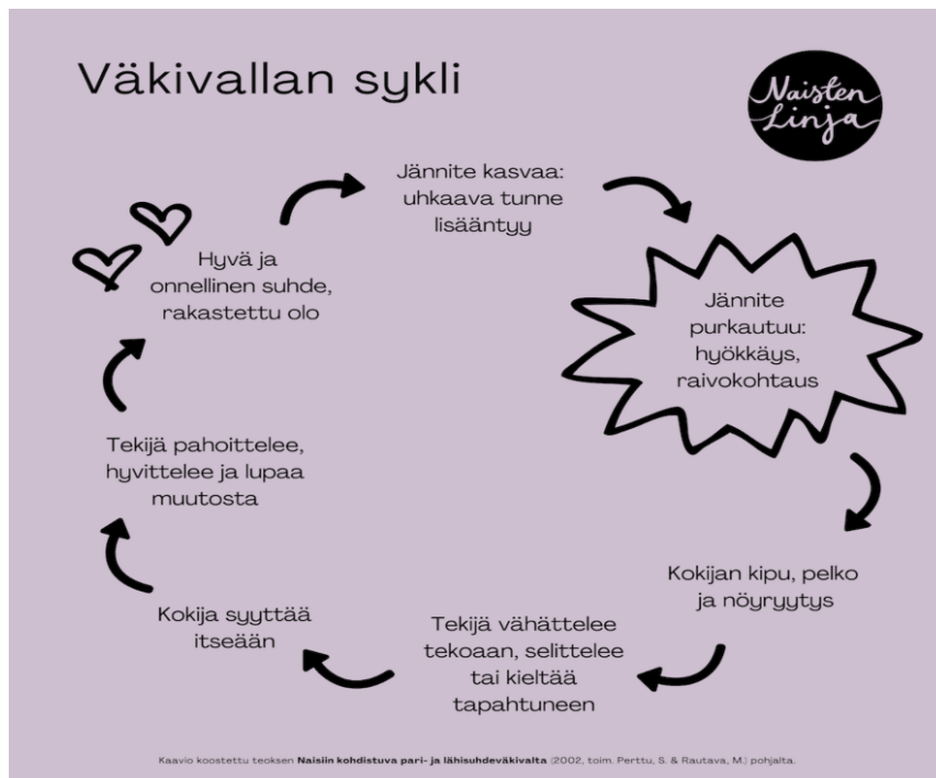
Kuvio 1. Väkivallan syklisyys ja muodot (Naistenlinja 2024).

Kuviossa 1 on esitelty lähisuhdeväkivallan syklin vaiheet, jotka sisältävät jännitteiden kasaantumisen, väkivaltaiset purkaukset, sovittelun ja rauhalliset ajat. Nämä vaiheet toistuvat ja vaikeuttavat lähisuhdeväkivallan tunnistamista ja siitä irtautumista. Väkivallan uhri voi jäädä tilanteeseen vangiksi, toivoen muutosta, mutta väkivallan kierre jatkuu. Väkivallan sykli usein toistuu ja väkivallan kuormittavuus kasvaa ajan myötä. (Naistenlinja 2024.)