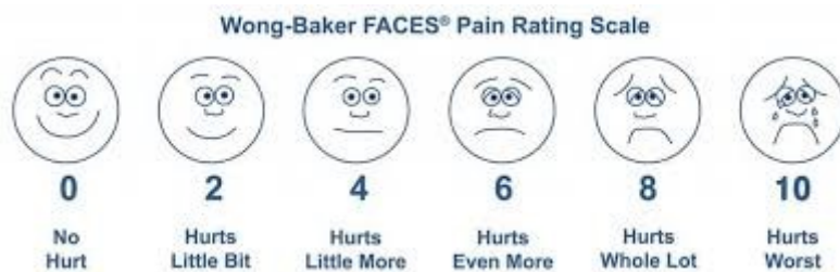
Kuvio 2 . Wong-Baker FACES- Pain Rating Scale ( Together By St.Jude tm 2018).