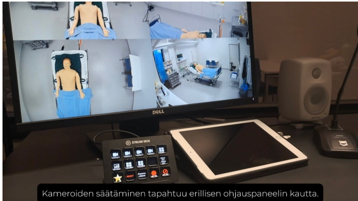
Kuva 4. Kameroiden ohjauspaneeli.

Keskirivin ensimmäisellä painikkeella saa pelkän monitorin näkyviin. Seuraava painike näyttää kolme kameraa sekä monitorin. Sitä seuraava painike näyttää kolme kameraa sekä monitorin eri kokoonpanolla.