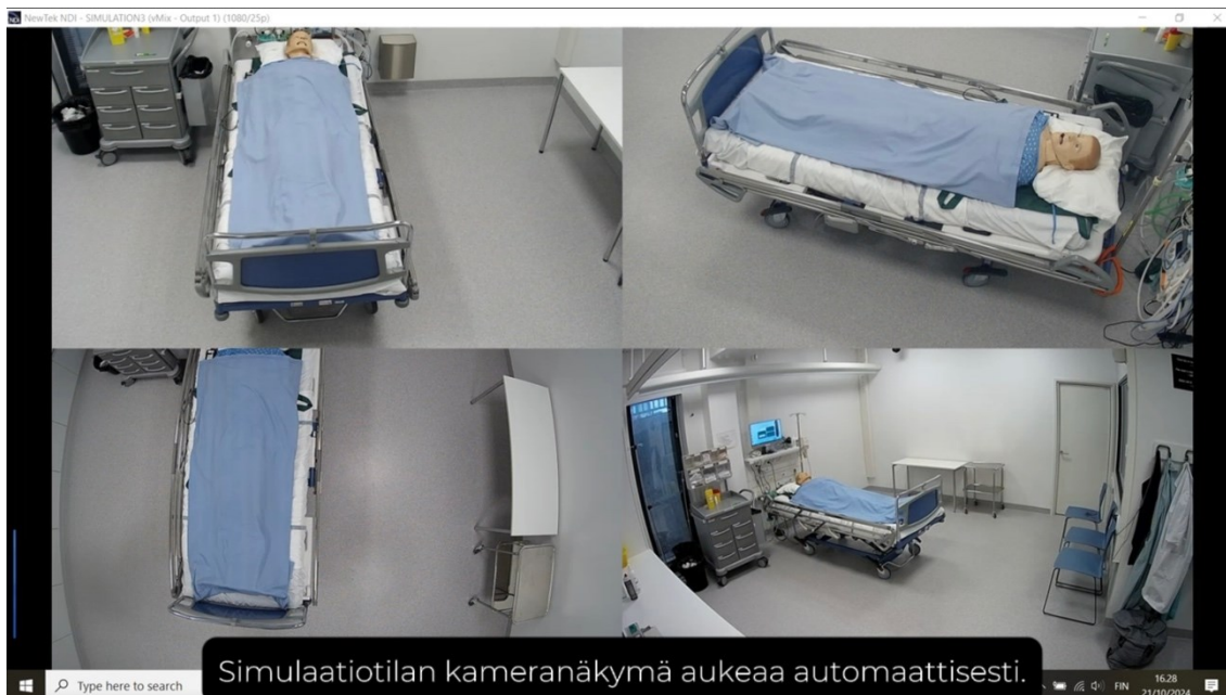
Kuva 6. Kameranäkymä debriefing-tilassa (Kuvakaappaus Debriefing-tilan videoyhteys ja tallenteen katselu –ohjevideosta).

Käynnistetään debriefing-tilan iso televisio. Tietokoneen näytön tulisi automaattisesti heijastua televisioon. Mikäli näin ei tapahdu, varmistetaan, että televisio on yhdistettynä HDMI1 kaapeliin.