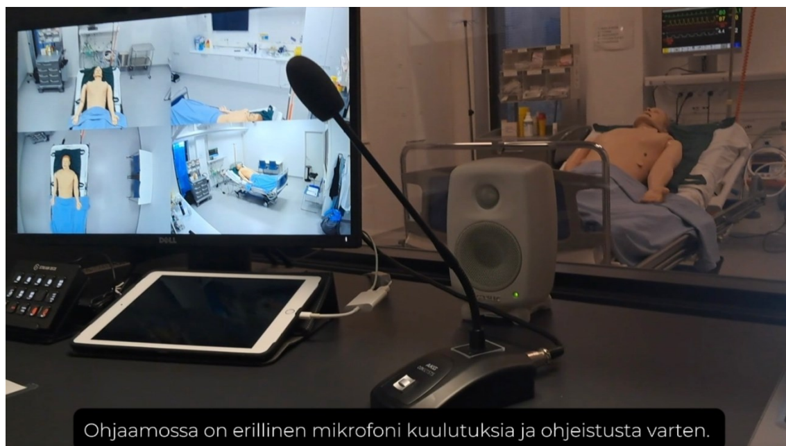
Kuva 5. Mikrofoni (Kuvakaappaus Kamerayhteys-ohjevideosta).

kun mikrofoni on valmis ja puheääni kuuluu simulaatiotilaan. Mikrofoni mykistyy vapautettaessa painike.