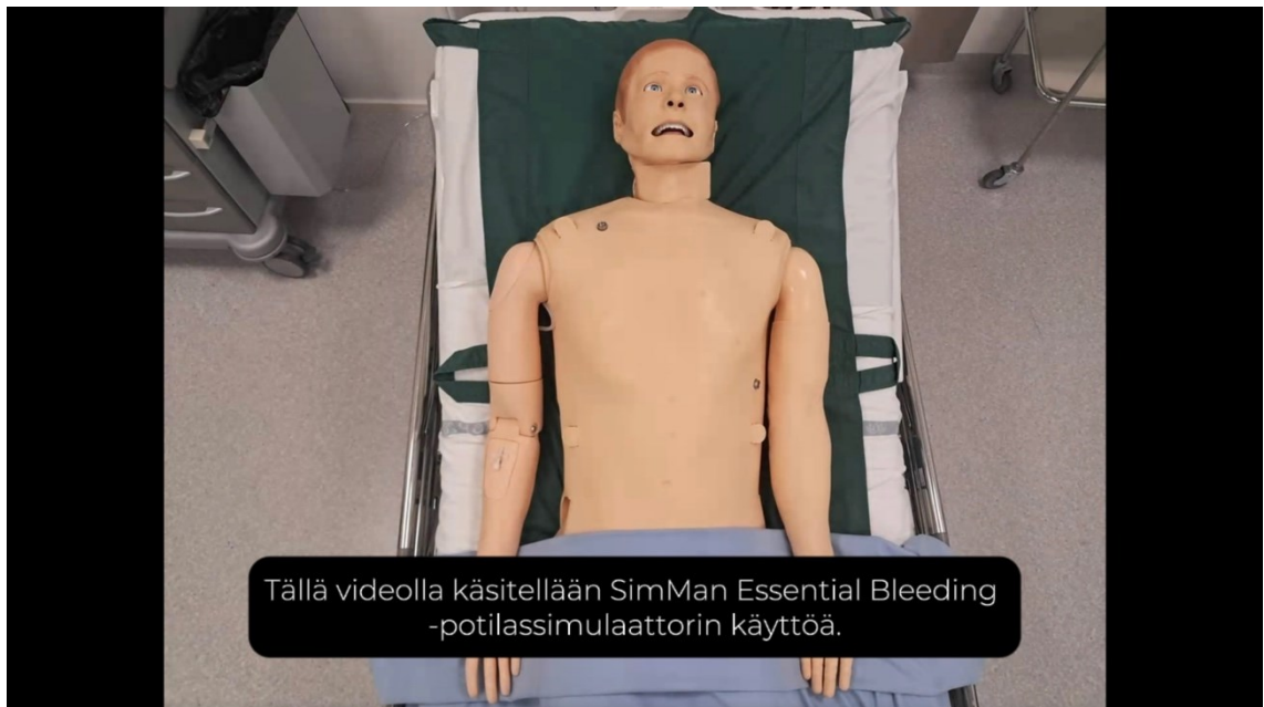
Kuva 1. Potilassimulaattori (Kuvakaappaus Potilassimulaattori-ohjevideosta).

Ensimmäisessä videossa (Kuva 1.) käsitellään SimMan Essential Bleeding -potilassimulaattorin eli simulaationuken toimintaa. Pääpaino on nukun teknisessä toiminnassa, eikä videolla keskitytä esimerkiksi kaikkien vitaalimittausten ottamiseen tai muiden tutkimuksellisten toimintojen suorittamiseen. Videolla esitellään nukkeen sisäänrakennettuja ominaisuuksia. Videolla näytetään, miten simulaationukke käytännössä toimii. Video on myös tekstitetty.