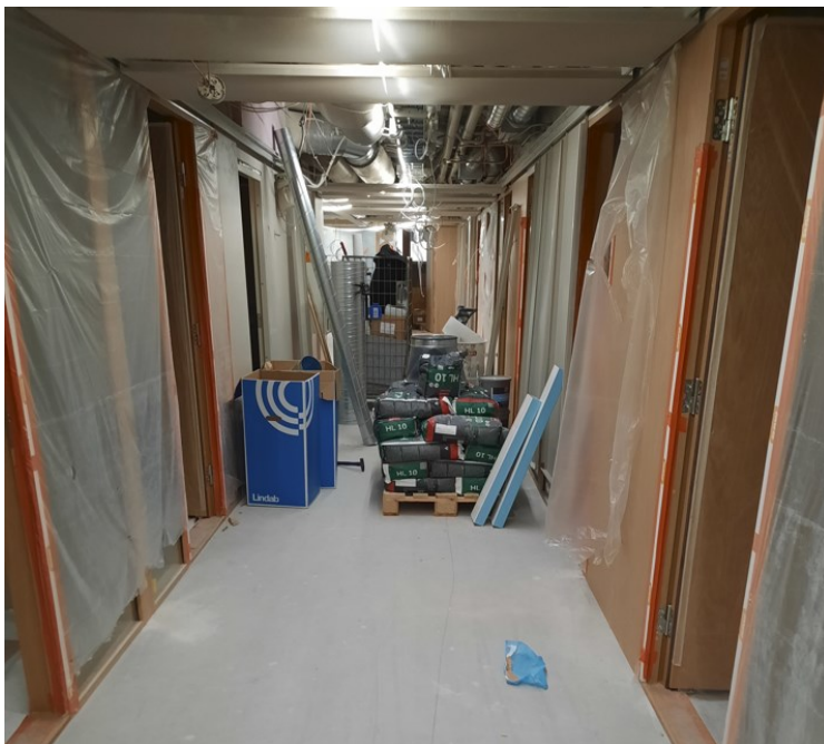
Kuva 5. Esimerkki keskeneräisestä työmaasta, jossa pitäisi aloittaa ilmanvaihdon mittaus- ja tasapainotustyö.

Ilmanvaihdon mittaus- ja tasapainotustyöhön sidoksissa olevia töitä aloitetaan jo aikaisessa rakentamisvaiheessa työmaalla. Runkovaiheessa tehdään ensimmäisiä ilmanvaihdon asennuksia ja rakennustekniikan osalta tehdään mm. ikkuna asennuksia, jotka vaikuttavat rakennuksen tiivyyteen. Useissa kohteissa ilmanvaihdon mittaus- ja tasapainotustyöhön liittyvien ongelmien syyksi on selvinnyt aikaisessa rakennusvaiheessa tehdyt virheet. Pääsääntöisesti nämä virheet pystyttäisiin ennaltaehkäisemään, kun työntekijät tietäisivät, mihin kaikkien puutteellisesti tehty työ vaikuttaa. Ilmanvaihdon mittaus- ja tasapainotustyö toimii työmailla erinomaisena laadunvarmistajana monelle rakennusvaiheen työlle. (15.)