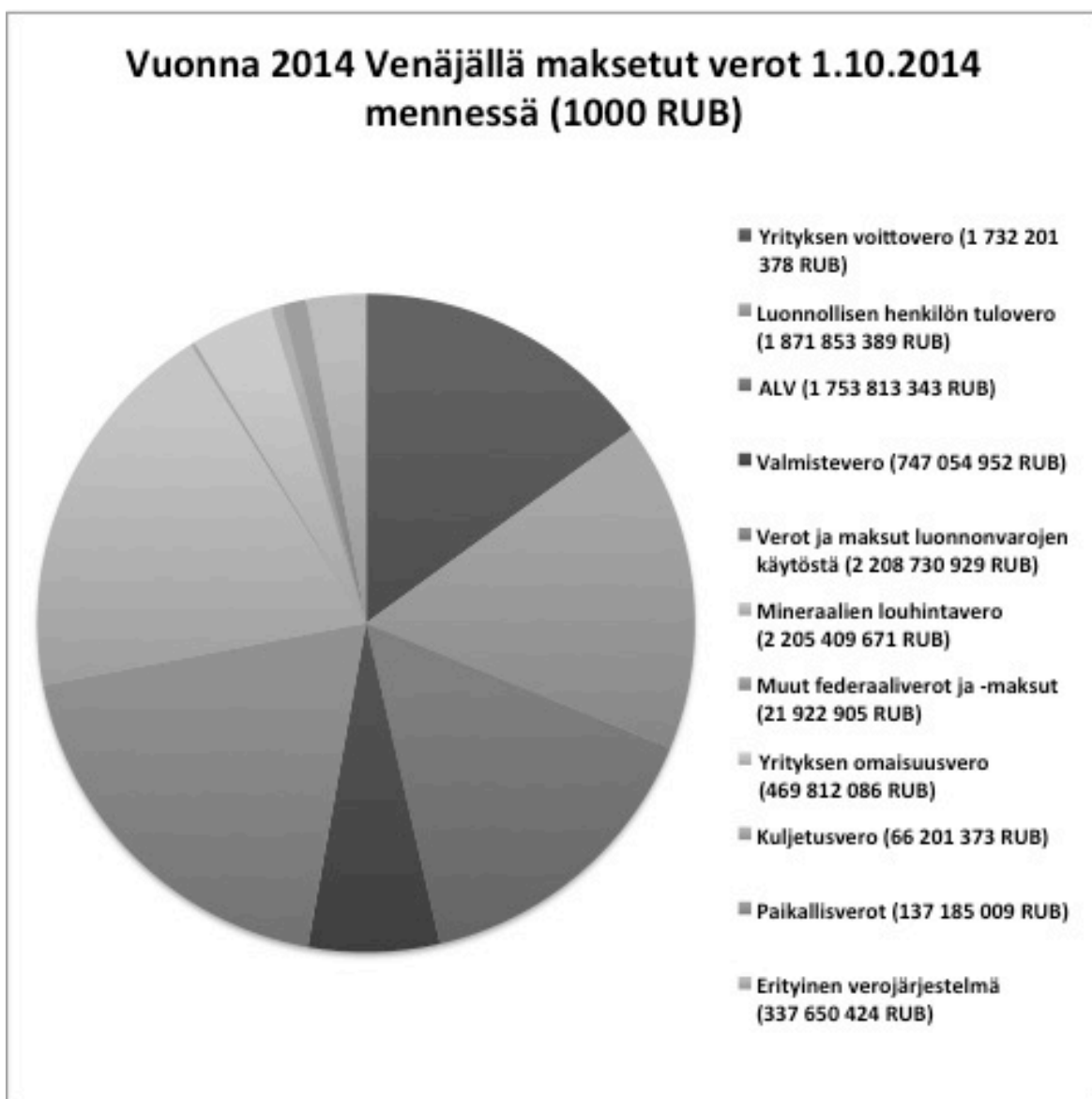
Kuvio 2. Venäjällä maksettujen verojen jakautuminen vuonna 2014 (Federalnaya nalogavaya sluzhba. Statistika)

Verotusaste on kiinteä 6% ja se lasketaan voitosta kuluvähennyksen jälkeen. Summaa voidaan pienentää, mikäli yritys on edellisinä vuosina kärsinyt tappioita. Raportointikausi maatalousverolle on puolen vuoden välein ja verotuskausi kerran vuodessa. Etukäteismaksu tulee tehdä 25 päivää raportointikauden päättymisen jälkeen ja lopullinen maksu seuraavan vuoden maaliskuun viimeiseen päivään mennessä. Mikäli yritys haluaa vaihtaa toisesta verotusmuodosta maatalousveroon, astuu muutos voimaan aina seuraavan vuoden alusta (Federalnaya nalogavaya sluzhba. Eshn).