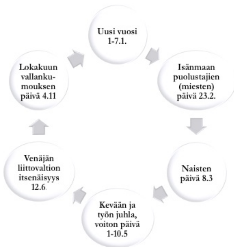
Kuvio 4. Venäläiset juhlapyhät (Alho ym. 2007, 128-129)

Venäjällä juhlat ovat erittäin tärkeitä ja hyvä syy kokoontua ystävien sekä suvun kesken syömään ja juomaan. Juhlia onkin moneen lähtöön ja mikäli ne osuvat viikonlopulle, on seuraava maanantai monesti vapaa töistä. Juhlakulttuurin keskiössä ovat lahjat, kukat sekä shampanja ja periaatteena onkin, ettei kylään mennä koskaan tyhjin käsin. Juhlapäiville bisnestapaamisia ei Venäjällä kannata suunnitella ja alla on esitelty tärkeimmät juhlapyhät venäläisessä kalenterissa.