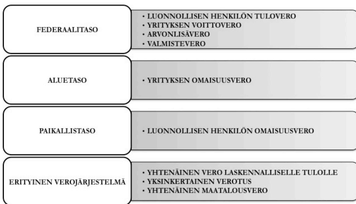
Kuvio 1. Yritysverotus Venäjällä jaettuna eri tasoihin (Federalnaya nalogavaya sluzhba)

Yrityksen perustamisen jälkeen valitaan yrityksen verotusmenetelmä ja rekisteröidytään veroviranomaisille. Venäjällä noudatettava verokoodeksi jaetaan kahteen osaan, joista ensimmäinen julkaistiin vuonna 1908 ja se tunnetaan nimellä ”Yleinen osa.” Jälkimmäinen osa tuli vasta vuonna 2000 ja siinä kerrotaan yksityiskohtaisemmin mihin eri tarkoituksiin veroja kerätään. Nämä maksut jaetaan tapauksesta riippuen federaali-, alue- tai paikallistasolle. Yhteisöjä ja yksityisiä elinkeinoharjoittajia koskevia verotusjärjestelmiä on pääasiassa kolme; yleinen, yhtenäinen vero laskennalliselle tulolle sekä yksinkertainen verotus. Tämän lisäksi valittavana on myös yhtenäinen maatalousvero. Yleinen verotusjärjestelmä pitää sisällään arvonlisäveron, yrityksen voittoveron, vakuutus- ja muut sosiaalimaksut sekä omaisuusveron. Alla on vielä havainnollistettu, miten verotus jakaantuu eri tasoille Venäjällä.