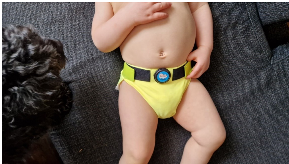
Kuva 1. NAPPA-pöksyt puettuna vauvalle.

Vaipan päälle puettavissa NAPPA-pöksyissä on pieni sensori, joka mittaa hengitystä vatsan liikkeistä. NAPPA-pöksyissä kiinni oleva Suunto Movesense -sensori on ohjelmoitu rekisteröimään lapsen yöllistä liikettä sekä unirytmijä kolmena peräkkäisenä yönä 12 tunnin ajan. NAPPA-pöksymittaus ohjelmoidaan NAPPA Logger -sovelluksen avulla. Huoltaja voi todeta sensorin olevan aktiivisena kahdesti minuutissa välkkyvän punaisen valon perusteella. (Vanhatalo, henkilökohtainen tiedonanto 2024.)