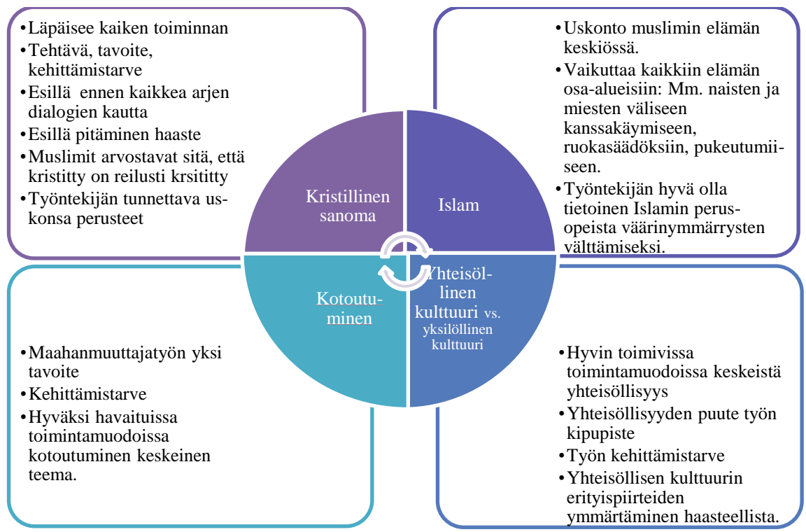
KUVIO 2. Tiivistetty kuvaus tutkimustuloksista

Tutkimustuloksissa korostui neljä pääteemaa, jotka tulivat esiin eri yhteyksissä läpi tutkimustulosten. Ne ovat läsnä tavalla tai toisella kaikessa muslimitaustaisten maahanmuuttajien parissa tehtävässä työssä, ja vaikuttavat lähes kaikessa ja kaikkeen. Pääteemat ovat: Kristillinen sanoma, islam, yhteisöllinen kulttuuri vs. yhteisöllinen kulttuuri ja kotoutuminen. Alla oleva kuvio (KUVIO 2) kiteyttää tutkimukseni päälöydökset.