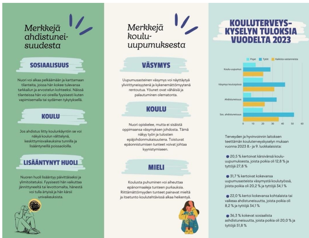
Kuva 1. Oppaan sisäpuoli

”Mistä apua?” -osiosta löytyy kohta, mihin jokainen kuraattori voi lisätä omat yhteystietonsa. Osioista löytyy myös selostukset kuraattorin, koulupsykologin, -terveydenhoitajan ja -lääkärin työtehtävistä, mitkä perustuvat oppilas- ja opiskelijahuoltolakiin (2013). Opiskelijahuollon ammattilaisten tehtävien avaamisen tarkoituksena on auttaa huoltajaa ymmärtämään ammattilaisten rooleja, kun hän ei tiedä keneen olisi yhteydessä. Tämä tieto voi myös tulla joillekin huoltajille uutena, mikä madaltaa vielä enemmän kynnystä olla yhteydessä auttaviin tahoihin. Lisäksi tästä osiosta on löydettävissä Palveluluukun ja Perheneuvon yhteystiedot sekä palvelupolut Eloisan verkkosivuilta. Näihin tahoihin usein ohjataan huoltajaa olemaan yhteydessä. Oppaassa palveluiden sisällöt ovat lyhyesti esitettynä, minkä tarkoituksena on selkeyttää tarjolla olevia palveluja. Palvelupolun avulla huoltaja voi helposti itse etsiä lisää tietoa Palveluluukusta ja Perheneuvosta niin halutessaan.