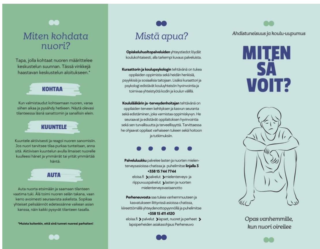
Kuva 3. Oppaan ulkopuoli

Kuvassa 3 näkyy oppaan etu- ja takakansi, sekä sisään taitettu osio. Kuvassa 4 näkyy oppaan sisäpuoli. Opas tulostetaan A4-paperiin kaksipuolisena. Paperi taitetaan niin, että ”Miten kohdata nuori?” ja ”Kouluterveyskyselyn tuloksia vuodelta 2023” kääntyy sisäänpäin, jolloin se on ”Merkkejä koulu-uupumuksen oireista” -osion päällä. Tämän jälkeen etukansi, eli ”Miten sä voit?” ja ”Merkkejä ahdistuneisuudesta” taitellaan edellisen taitoksen päälle, jolloin ”Miten kohdata nuori?” peittyy etukannen alle. Tällöin lukijan kädessä on opas, joka on yksi kolmasosa A4-paperista. Avatessaan oppaan täyteen kokoonsa hän näkee kuvan 4 sisällön ja kääntäessään paperin hän näkee kuvan 3 sisällön.