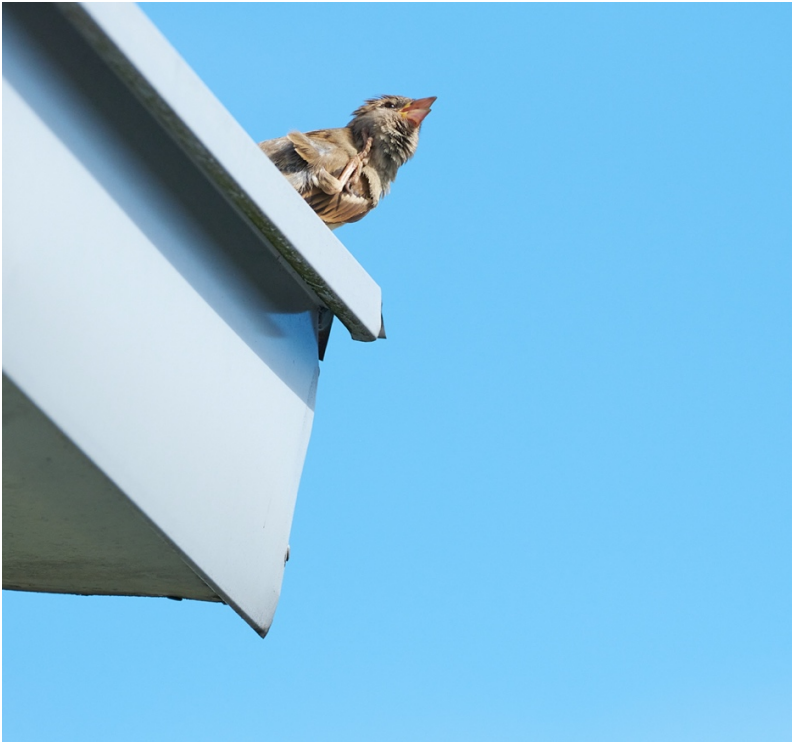
Varpunen parvekkeen kulmalla.