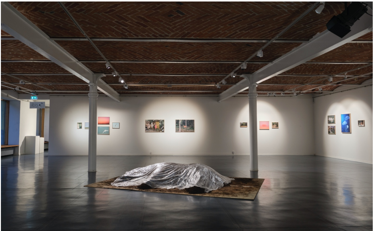
Deer, Dirt, Monkey and Bones Vaasan taidehallilla.