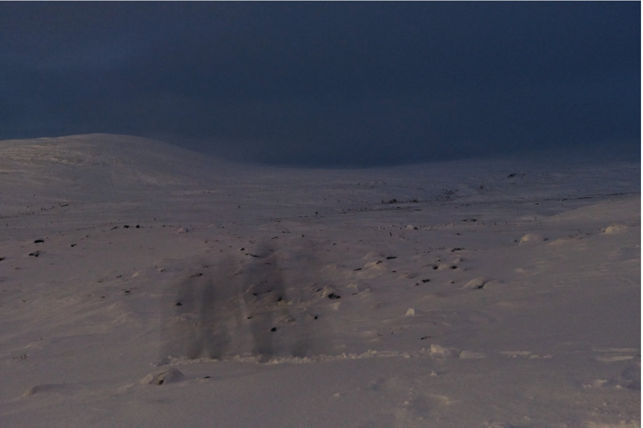
6.11.23 On vain rajaton valkoisuus tai harmaus tai sinisyys. (S)