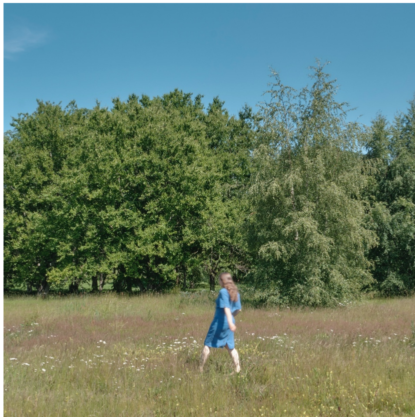
Omakuva niityn kanssa.

Teosteni taustalla vaikuttaa laaja joukko kysymyksiä ihmisyyden väkivaltaisesta puolesta; vallasta, sorrosta, toiseuttamisesta, haltuunotosta, yksilökeskeisyydestä, kategorioista ja rajoista. Taiteellinen työni on tapani osallistua maailmaan ja yritykseni käsitellä, kysyä ja haparoida näiden teemojen parissa ympäristökadon ja sortoon taipuvien yhteiskuntarakenteiden keskellä. Merkityksiä työhön luovat jonkinlainen ruumiillinen tieto erilaisten kohtaamisten ihmeellisyydestä, vuotavasta sekoittuneisuudesta ja havainnot ja oppiminen erilaisten olentojen ainutkertaisuudesta sekä tarpeellisuus ja nautinto taiteellisesta tekemisestä. Työskentelyn kauttakulkevana ydinkysymyksenä on; miten me ihmiset olemme täällä toisten kanssa ja miten kohtaisimme toisia ilman pakottamista ja väkivaltaa? Miten työskennellä näiden monisuuntaisten ja laajojen teemojen parissa taiteen kautta?