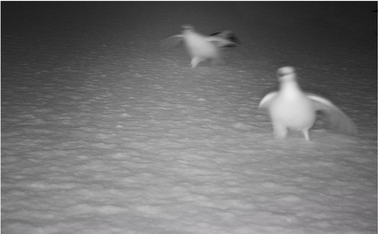
Riistakamerakuvassa riekot Pikkuvaaralla 2022.

Pohdin miten valokuva johdattaa minua näkemään, oppimaan, perehtymään, sitoutumaan ja työskentelemään tällaisten paikkojen kanssa. Minkälainen on valokuvan paikka ja olemus osana tätä kokemusta ja ajattelua? Miten ekologinen ajattelu sisältyy valokuvan tapahtumaan ja lopulta valokuvaan? Miten erilaisten lajien, paikkojen ja olosuhteiden kauneuden näkeminen ja esteettinen kokemus on myös ekologiaan ja yhteiseloön liittyvä kokemus?