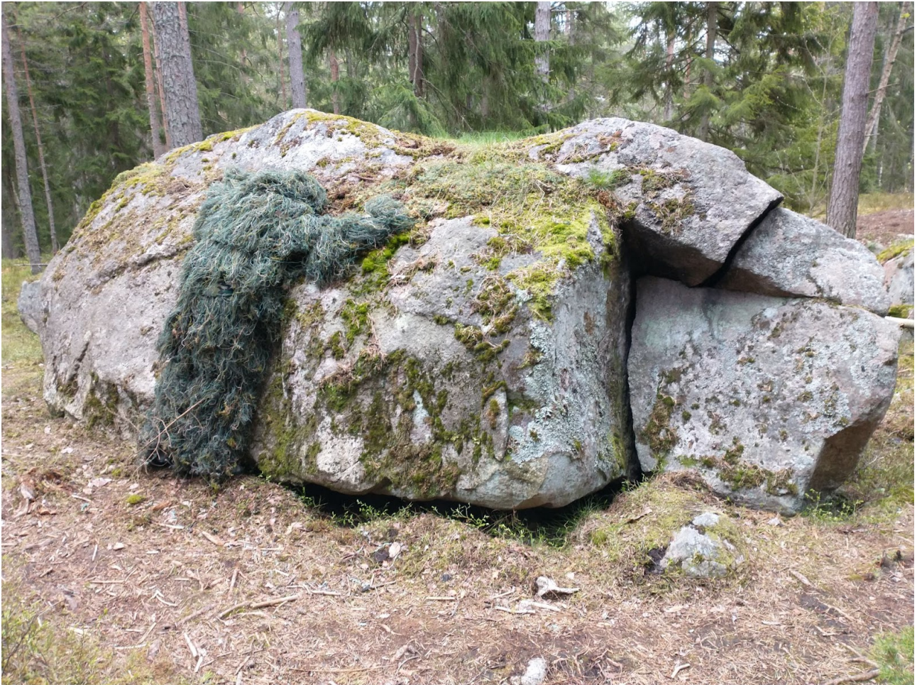
Planty-teoksen harjoituksissa vuonna 2020.