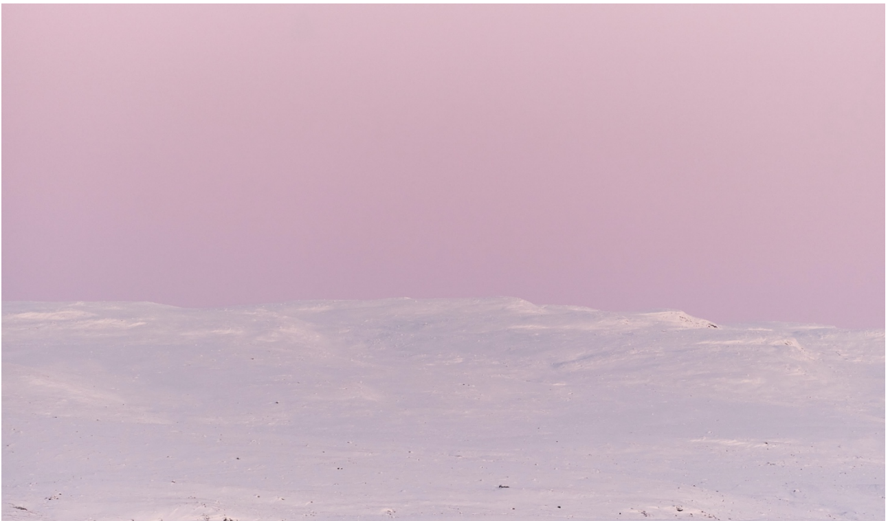
Jiehkkaš/Korkea-Jehkas marraskuun valossa.