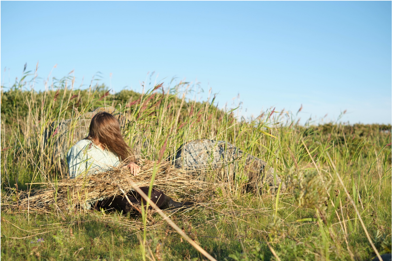
Ruovikon kanssa Lintukarilla.

sortoon. Teema nousi erityisesti Deer, Dirt, Monkey and Bones -teoksen työskentelyaikana esiin, mutta oli myös itsestään selvä lähtöasetelma Snowy -teoksen äärellä. En kuitenkaan avaa tutkimuksellisessa opinnäytetyössäni tarkemmin feministisiä teorioita työni rajauksen vuoksi. Ajattelen niiden kuitenkin vaikuttavan taustalla ja feminiinin rönsyävän teosteni ja kirjoitukseni lävitse.