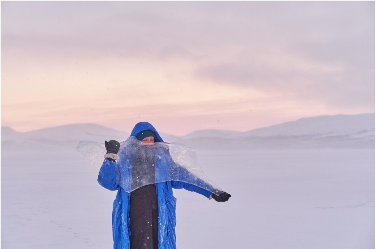
Heli ja jäät.