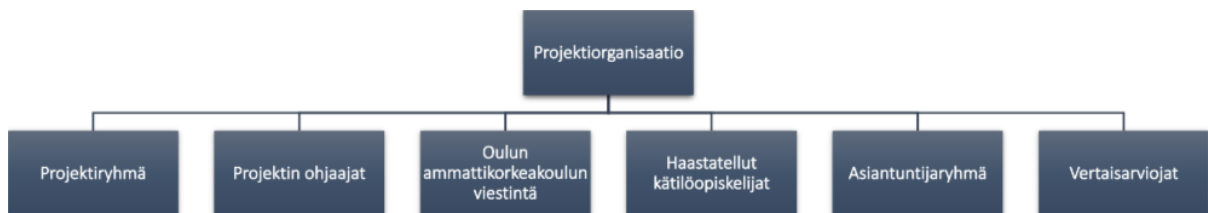
Kuvio 2. projektioorganisaatio