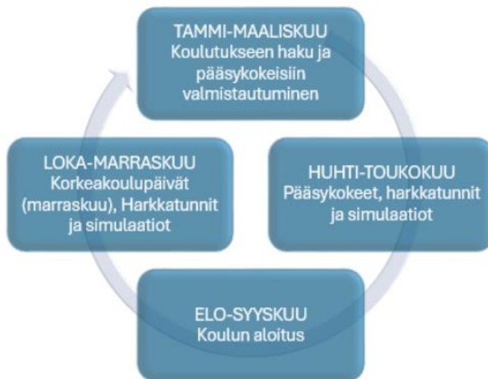
Kuvio 3. Vuosikello

Tämän projektin tuotoksia ovat Oulun ammattikorkeakoulun verkkosivuille lisätyt kättilöopiskelijoiden ja kansainvälisessä opiskelijavaihdossa olleiden opiskelijoiden haastattelut (Liitteet 2–4). Sekä Oulun ammattikorkeakoulun kättilökoulutuksen virallisen Instagram-tilin markkinointisuunnitelma vuosikellon muodossa. Yksi projektin tuotoksista on myös tämä loppuraportti, joka löytyy Theseus –tietokannasta.