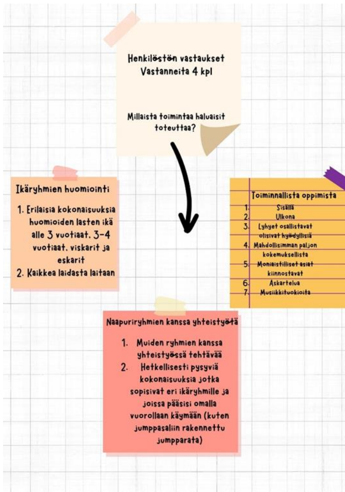
Kuvio 3, Henkilöstön vastaukset 2