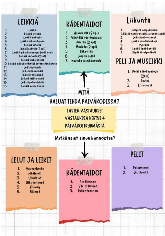
Kuvio 5, Lasten vastaukset