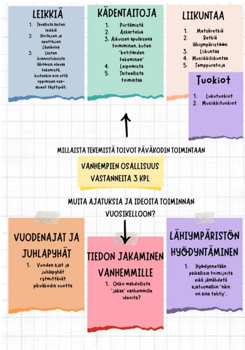
Kuvio 4, Vanhempien vastaukset