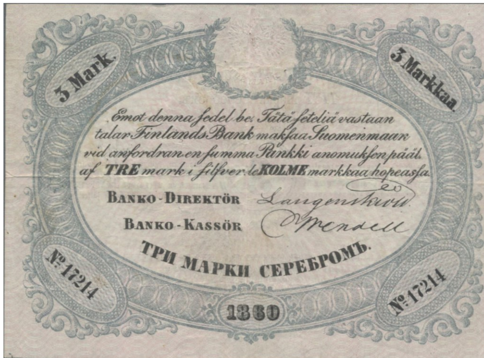
Kuva 9. Aidon 3 markan setelin 1860 No 17214 etupuoli. Kuvalähde: https://p1.auktionen-gaertner.de/FILE/GPKATAUK45/77/4D/774D76/s724202.jpg Kuvan muokkaus Jorma Imppola, SeAMK.

Hyvin kuvaava ja myös surullinen on suomalaisen vuoden 1860 3 markan setelin No 17214 tarina. Kyseinen seteli oli kaupan 8. lokakuuta 2019 Auktionshaus Christoph Gärtner GmbH & Co. KG:n huutokaupassa Sale #45 Banknotes Worldwide kohdenumerolla 1524. Kohteen lähtöhinta oli 900 € ja sen myyntihinta oli 2 500 € + 23,8 % + 2 € komissio = 3 097 €.