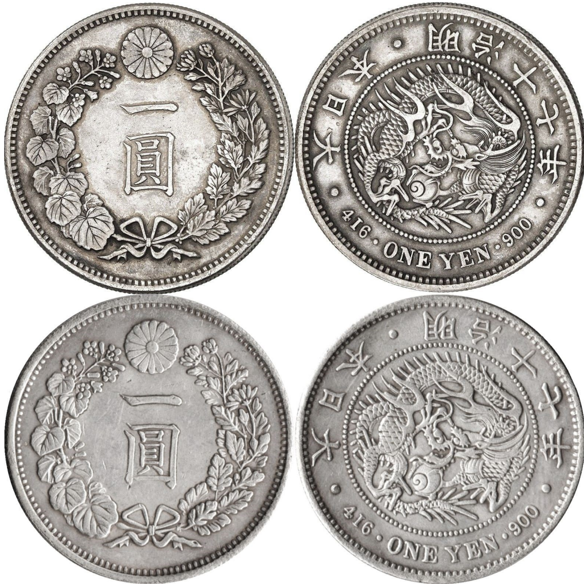
Kuva 4. Japanin vuoden Meiji 17 (1884) yhden yenin hopearaha. Ylhäällä alkuperäinen hopeinen raha, alinna kopioraha. Huomatkaa kopion erilainen värisävy ja yleinen epätarkkuus. Muuten kopio on erehdyttävän samankaltainen syrjähammastusta myöten. Paino poikkeaa aidon 26,96 grammasta melkoisesti ollen vain 17,96 grammaa. Kuvien muokkaus ja yhdistely: Jorma J. Imppola, SeAMK

Eli nykyään voi jo lähteä siitä oletuksesta, että kaikkiin toreilta, turuilta ja kadunvarsilta ostettuihin ”harvinaisuuksiin” pitää suhtautua hyvin kriittisesti. Myös internetissä – niin kotimaisilla kuin ulkolaisillakin nettimyymyjillä - on eri kauppapaikoilla avoimesti kaupan valtavasti niin Suomen kuin muunkin maailman keräilyrahojen arvottomia kiinalaiskopioita. Pääosin kiinalaiset tekeleet ovat enemmän tai vähemmän hyvälaatuisia rautaseoskopioita (kannattaa pitää kaupanteossa jotain pikku magneettia mukana), mutta kiinalaiset ovat kuuluja oppivaisuudestaan, joten pitääkö varanne! Katsokaa vaikka kuvien 2, 3 ja 4 esimerkkejä, niiden ulkoasu on pelottavan hyvää laatua.