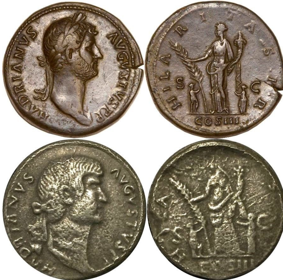
Kuva 1. Rooma, Hadrianuksen (117 – 138) vuosien 128 – 132 välillä lyöty sestertius. Ylhäällä alkuperäinen pronssiraha (paino 27,11 g), alinna valettu kopioraha (paino 15,02 g). Molempien rahojen halkaisija on noin 32 mm. Alemman kopiorahan laatu puhuu puolestaan.

Tämä on vastenmielinen ja hyvin monilukuisa väärennösten ryhmä. Näistä klassisimpia ovat turistikohteissa turisteille usein aitoina kaupatut "antiikin" rahat, joita valmistetaan monenmoisia kaikenlaisissa pajoissa ja jotka ovat usein sekä laadullisesti kehoja että vailla minkäänlaista arvoa.