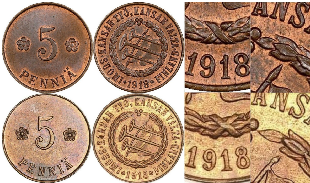
Kuva 5. Kansanvaltuuskunnan 5-pennisten vertailua. Ylhäällä alkuperäinen KV I raha, alinna KV II kopioraha. Huomatkaa osasuurenoksien seppeleen alhaalla olevan solmukkeen asema

Varsin nopeasti syntyi epäily markkinoille pelmahtaneen varsin runsaslukuisen uuden erän alkuperästä, ja huomattiinkin, että uuden erän rahat olivat tunnuspuoleltaan erilaisia kuin alkuperäiset. Heinäkuussa 1926 Suomen Kuvalehdessä ilmestyneessä Väinö I. Vainion kirjoittamassa artikkelissa oli kuvattuna niin sanoin kuin kuvin aidon ja kopioidun Kansanvaltuuskunnan 5-pennisen tunnuspuolten erot. Klassisimpia ovat lipputangon kärjen asema oikeanpuoleiseen laakeriseppeleeseen nähden sekä seppeleen ruusukkeeseen ja vuosiluvun 1918 keskinäinen asema. Koska Rahapajassa ei oltu tehty mitään toisia tunnuspuolen meistejä, kävi ilmeiseksi, että kyseessä on Rahapajan ulkopuolella tehty väärennös tai kopio.