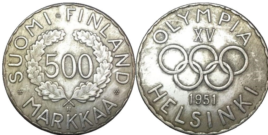
Kuva 8. Kiinalainen tekele vuoden 1951 olympiarahasta. Kuvien muokkaus ja yhdistely Jorma J. Imppola, SeAMK

Ja kuinkas ollakaan, ovat ahkerat ystävämme kiinalaiset tunkeneet lusikkansa tähänkin soppaan. Useammastakin venäläisestä (niinpä niin) nettikaupasta löytyy ”sopuhintaan” (1,70 - 3,00 USD sisältäen postikulut) vallan hopeoituja kopioita vuoden 1951 olympiarahasta. Kiinan kopioissa on kuitenkin rahan syrjässä kalevalakäsikuvioinnin sijaan hammastus, joten tunnistaminen on helppoa. Vaikka nykyisin ovat kaupalliset kontaktit Venäjälle jäissä, lienee näitäkin tullut Suomen numismaattisilla markkinoille ja eiköhän joku sieluton ku**pää näitäkin tyrkytä aitoina pahaa aavistamattomille keräilijöille.