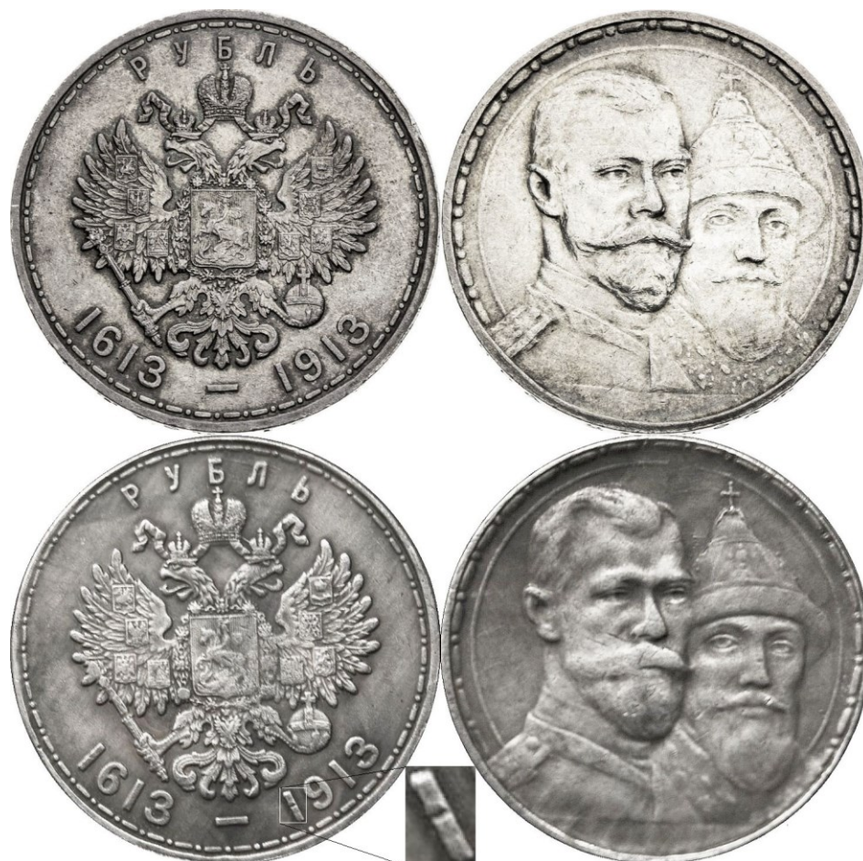
Kuva 2. Venäjän vuoden 1913 Romanovin hallitsijasuvun 300-vuotisjuhlarupla. Ylhäällä alkuperäinen hopeinen raha, alinna kopioraha.

Viime aikoina on Kiinasta tullut oikea keräilyrahakopioiden suurtuottaja. Näitä kiinalaisten kopioita mitä tavallisimmista isoista hopearahoista alkavat olla koko maailman kirpputorit, rojukaupat ja netin kauppapaikat täynnä. Onneksi ne ovat useimmiten varsin kehnoa laatua, hyvin usein selvästi alipainoisia ja magneettisia, joten keräilijöiden on varsin helppo ne tunnistaa. Ja totta kai ystävämme kiinalaiset ovat myös suoltaneet valtavat määrät kopioitaan arvokkaistakin rahoista.