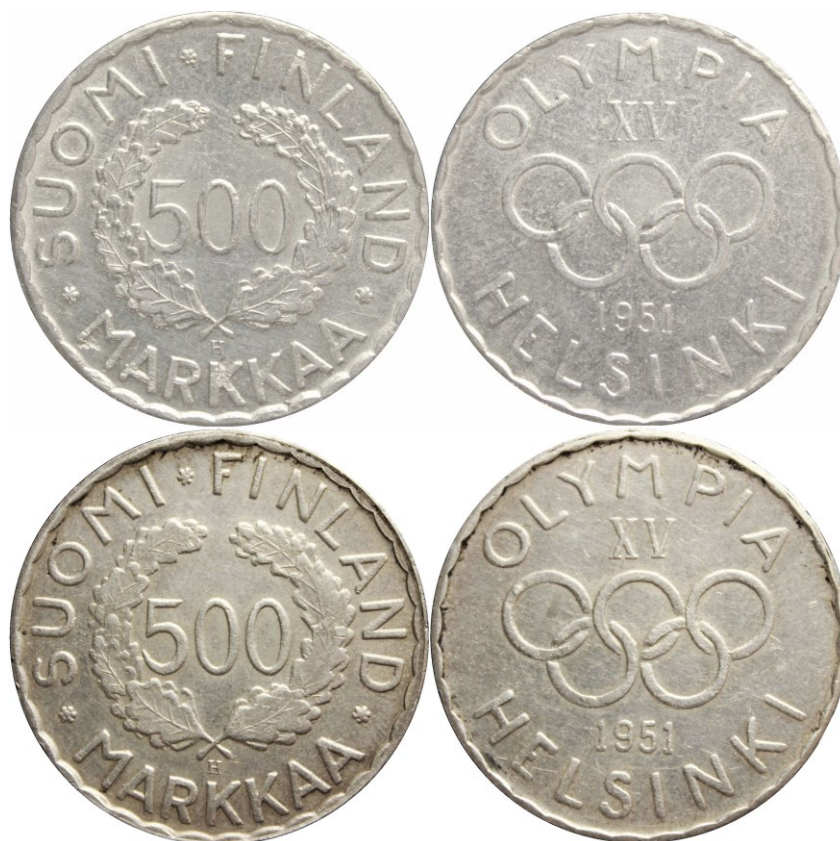
Kuva 6. Aito (ylempi) ja väärä (alempi) 500 markan olympiaraha vuodelta 1951.

Kuten vertailukuvasta 6 näkyy, ei väärennetty 500 markan olympiaraha vuodelta 1951 ole mitenkään erityisen hyväkuntoinen. Tämä johtui siis siitä, että malliksi annettu aito raha ei sekään ollut mitenkään erityisen hyväkuntoinen. Kopiointimenetelmästä johtuen olivat kaikki väärennökset identtisiä mallirahan kanssa – kuntoineen ja virheineen.