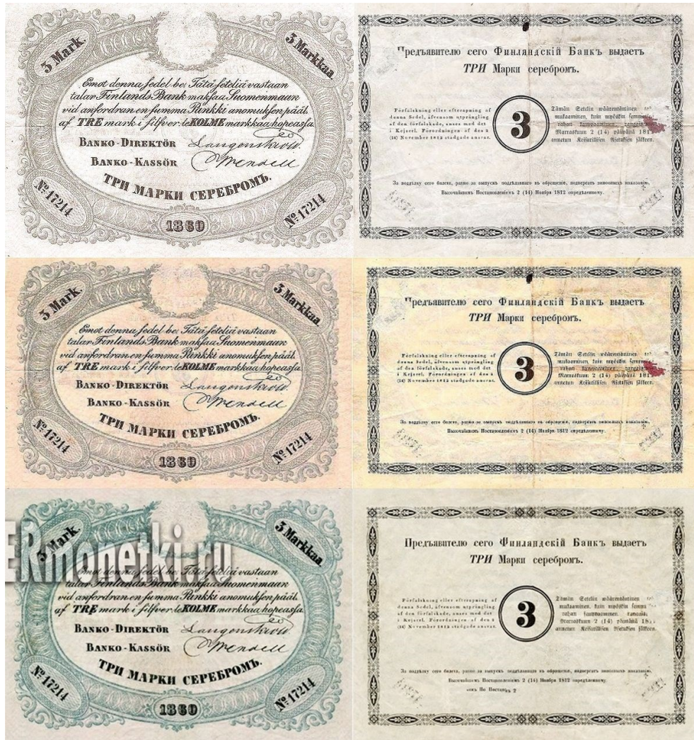
Kuva 11. 3 markan setelin 1860 No 17214 kopioita. Huomatkaa alimman kopion ”turvateksti” kuvan päällä, eikä tämä kopiotrokari ainakaan halua kuviaan käytettävän uusien kopioiden tekemisen apuna! Huomatkaa myös kahden alimman kopion keskitetty taustapuoli, aidossa setelissä on taustapuolen painatus siirtynyt ylimmän kopion lailla hieman vasemmalle. Kuvien yhdistely ja muokkaus Jorma J. Imppola, SeAMK.

Näiden keräilijöiden harhauttamiseksi tehtyjen kopioiden pahin ongelma on siinä, että ne varsin usein ajautuvat keräilymarkkinoille ihmisten joko tietoisesti tai tietämättään myydessä niitä aitoina. Näiden kopioiden ongelma on myöskin se, että jos niitä löytyy yksikin kappale kokoelmasta ”aitona”, se luo vahvan epäilyksen varjon koko kokoelmaan ja siten saastuttaa sen. Sama koskee huutokauppoja ja rahakauppiaitakin – ken kerran keksitään, sitä aina epäillään.