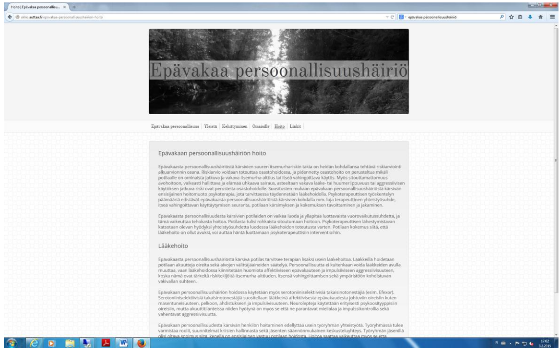
Kuva 1. Kuvia valmiista verkkosivuista.