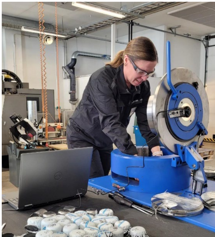
Kuva 1. Teräksen muovattavuuden testausta Lapin AMKin Kemien kampuksella

Lapin ammattikorkeakoulun konetekniikan koulutusohjelmaan sijoittuvassa Uudistuvan teollisuuden osaamisryhmässä Kemissä tehdään teräsmateriaalien tutkimusta. Kuvassa 1 nähdään rikkovan aineenkoetuksen laboratorioissa sijaitseva tutkimuslaitteisto ja laitteella testattuja teräsnäytteitä, joista analysoidaan materiaalin muovattavuutta.