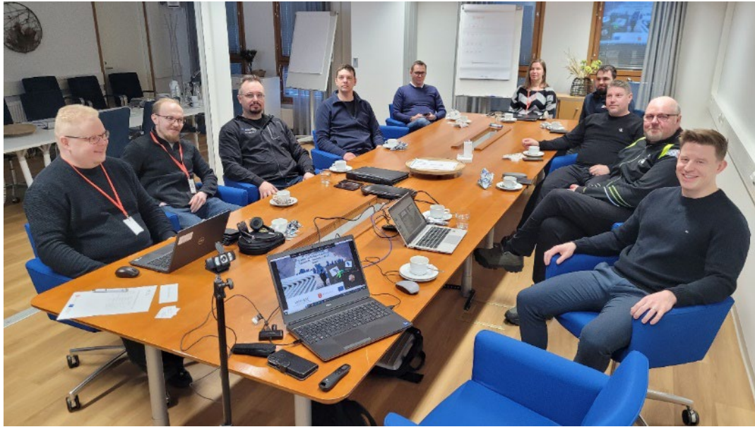
Kuva 2. FormFuture-hankkeen työpaja

FormFuture –hankekokonaisuus kasvattaa kädenjälkeä sekä vaikuttavuutta luoden uutta modernimpaa valmistustekniikkaa Lapin alueen yritysten käyttöön. Tiivis yhteistyö alueen yritysten kanssa kasvattaa kädenjälkeä, joka on tärkeä osa tulevaisuuden toimintoja ja kädenjälki nähdään positiivisena asiana.