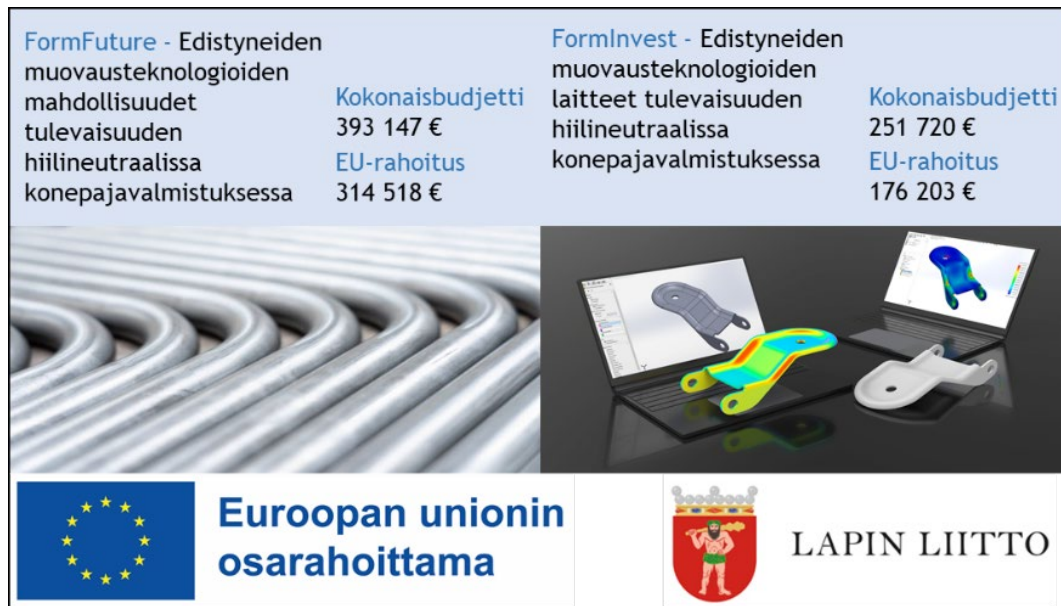
Kuva 3. FormFuture –hankekokonaisuuden esittely.

Vastuullisuus on nostettu Lapin AMKin strategiseksi valinnaksi, joka ohjaa paitsi koulutuksen ja TKI-toiminnan sisältöjä, myös koko ammattikorkeakoulun ja sen sidosryhmien toimintaa. FormFuture -hankekokonaisuudessa vastuullisuus näkyy kaikessa toiminnassa, ja sillä pyritään saamaan konkreettisia vaikutuksia, kuten esimerkiksi fossiilivapaiden materiaalien vähäpäästöisyys, energian kulutuksen vähentäminen, hiilijalanjäljen laskeminen tai kierrätettyjen teräsmateriaalien hyödyntäminen jatkossakin.