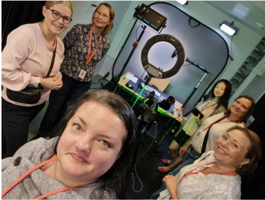
Kuva 2. Kiertotaloutta edistettiin toimialarajat ylittäen suunnittelemalla yhteistoimintaa Lapin AMKin kehittämissympäristöihin.