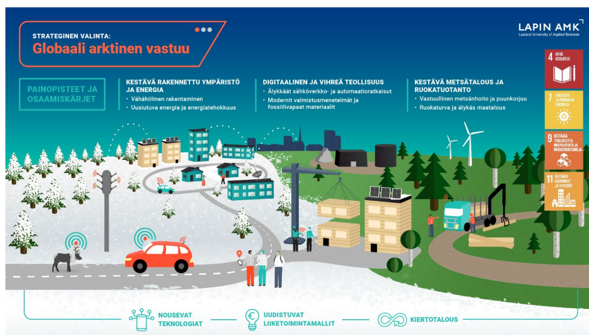
Kuva 3. Lapin AMKin yksi strategisista valinnoista; Globaali arktinen vastuu sekä kuvan alareunassa olevat poikkileikkaavat vahvuudet (Kuva: Lapin AMK 2024).

Lapin AMK:ssa strategiassa kiertotalous on nostettu suoraan toiminnan keskiöön yhdessä muiden poikkileikkaavien teemojen kanssa (Kuva 3). Kiertotalouden poikkileikkaavuus on tunnistettu Lapin AMK:ssa jo vuosia sitten, ja nyt siihen on panostettu strategisten toimenpiteiden avulla entistä voimallisemmin. Kiertotalouden teemassa on muodostettu tavoitteita, joilla on vaikutusta eri tasoilla: paikallisella, kansallisella ja kansainvälisellä.