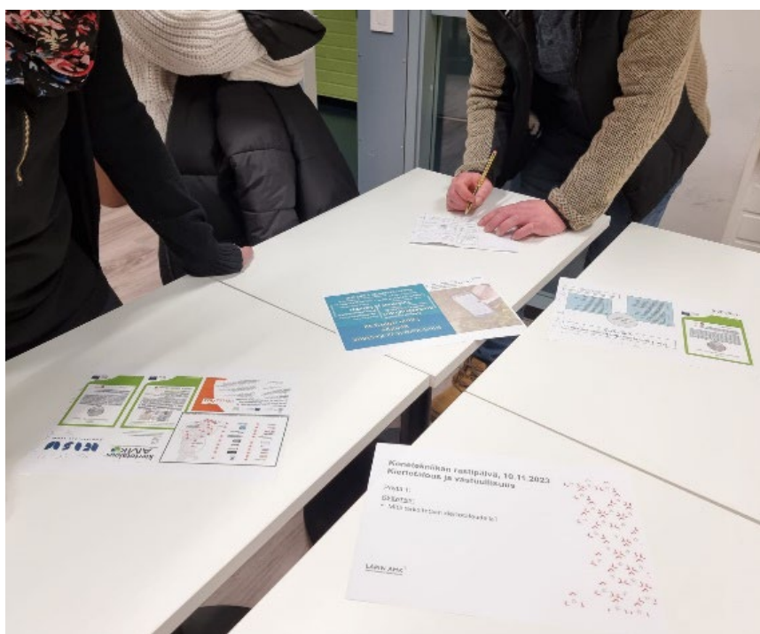
Kuva 1. Kiertotaloustoimijoiden järjestämässä monialaisessa työpajassa pohdittiin erilaisia vaihtoehtoja kiertotalouden toteuttamiselle.

Eri toimialoilla on erilainen ymmärrys siitä, mitä kiertotalous voi tarkoittaa. Siksi termi onkin yhtä aikaa haastava sekä monipuolinen, siihen liittyy monia näkökulmia ja aihealueita. Kiertotalouden pääperiaate on kuitenkin kaikille lähes sama; harkitse mitä tarvitset ja suunnittele kestäviä tuotteita, joita voi kierrättää käytön jälkeenkin. Kiertotaloutta tarkastellessa ei ole yhtä ainoa oikeaa vastausta tai tapaa toteuttaa sitä, on vain paljon vaihtoehtoja ja mahdollisuuksia soveltaa se omaan toimintaan. Lapin AMK on edistänyt eri alojen näkökulmien avaamista ja kiertotaloustoimien kehittämistä eri kokoisten yritysten ja organisaatioiden kanssa mm. järjestämällä monialaisia tapaamisia, työpajoja ja tilaisuuksia sekä tekemällä TKI-toimintaa yli toimialarajojen (kuva 1 ja 2).