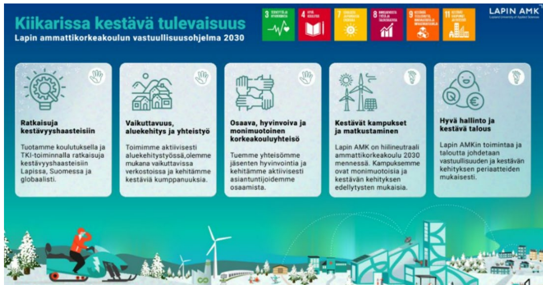
Kuvio 2: Lapin ammattikorkeakoulun vastuullisuusohjelma. (Lapin ammattikorkeakoulu 2024)

Kiertotalouden ja vastuullisuuden kehittämistyötä jatketaan kuten ennenkin, tunnistetaan kehittämisen paikat, havainnoidaan ympärillä olevat nousevat tarpeet ja tehdään työtä näkyväksi systemaattisella kehitystyöllä. Lapin ammattikorkeakoululla on hyvät puitteet olla mukana tulevaisuuden nousevien trendien kehittämisen kärjessä.