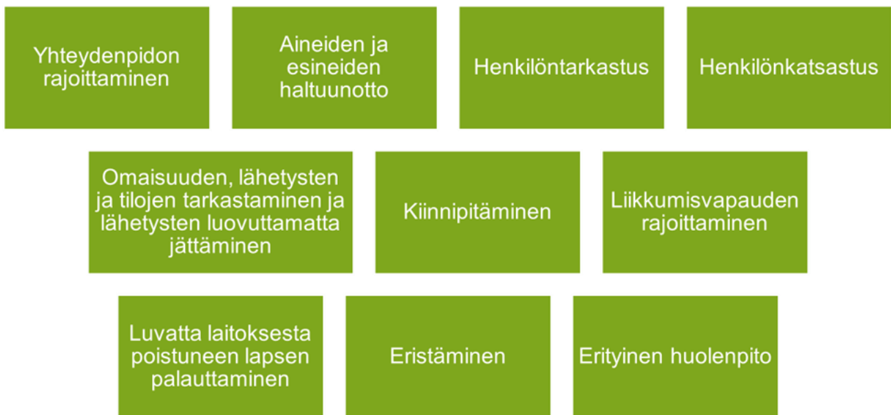
Kuvio 1. Rajoitustoimenpiteet sijaishuollossa (Lastensuojelulaki 417/2007).

Sijaishuollossa on kymmenen erilaista lastensuojelulakiin kirjattua rajoitustoimenpidettä (Lastensuojelulaki 417/2007; kuvio 1). Rajoitustoimenpiteillä voidaan muun muassa rajoittaa lapsen yhteydenpitoa, haltuun ottaa tältä luvattomia aineita tai esineitä, estää poistumasta sijaishuolto paikasta ilman aikuista sekä pitää lapsesta kiinni tämän rauhoittamiseksi ja kaikkien turvallisuuden takaamiseksi. Rajoitusten käytön seurannan ja valvonnan vuoksi kaikki käytetyt rajoitustoimenpiteet tulee raportoida kirjallisesti. Kirjauksesta tulee selvittää käytetty rajoitustoimenpide, käytännön toteutus, mahdolliset samanaikaiset rajoitukset, rajoituksen perusteet sekä päätöksen toteuttaneet ja siitä päättäneen henkilön nimet. Kirjaukseen selvitetään myös lapsen mielipide rajoituksesta, rajoituksen vaikutukset lapsen kanssa jatkossa tehtävään työhön sekä se, miten lasta on kuultu ennen rajoituksesta päättämistä.