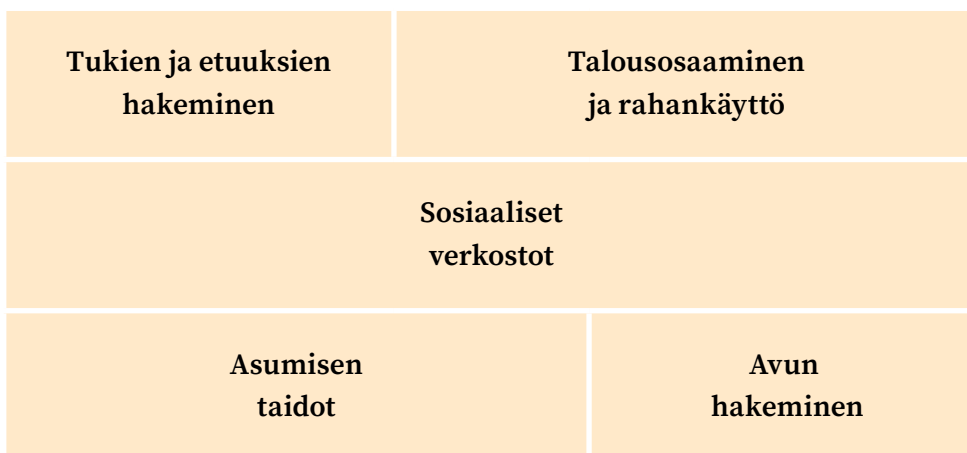
Kuvio 1. Itsenäisen asumisen haasteet teemoittain

Ammattilaisten vastaukset ryhmiteltiin toistuvasti esiin tulleiden teemojen mukaisiksi kokonaisuuksiksi. Ammatillisissa haastateltavina ja kyselyihin vastajina oli sekä viranomaisia että esimerkiksi kolmannen sektorin toimijoita, mutta heidän esiin nostamansa asiat ovat hyvin samankaltaisia. Tässä luvussa käydään läpi teemoja, jotka ammattilaisten mukaan haastavat lastensuojelusta omaan asuntoon muuttavan nuoren arkea ja asumista.