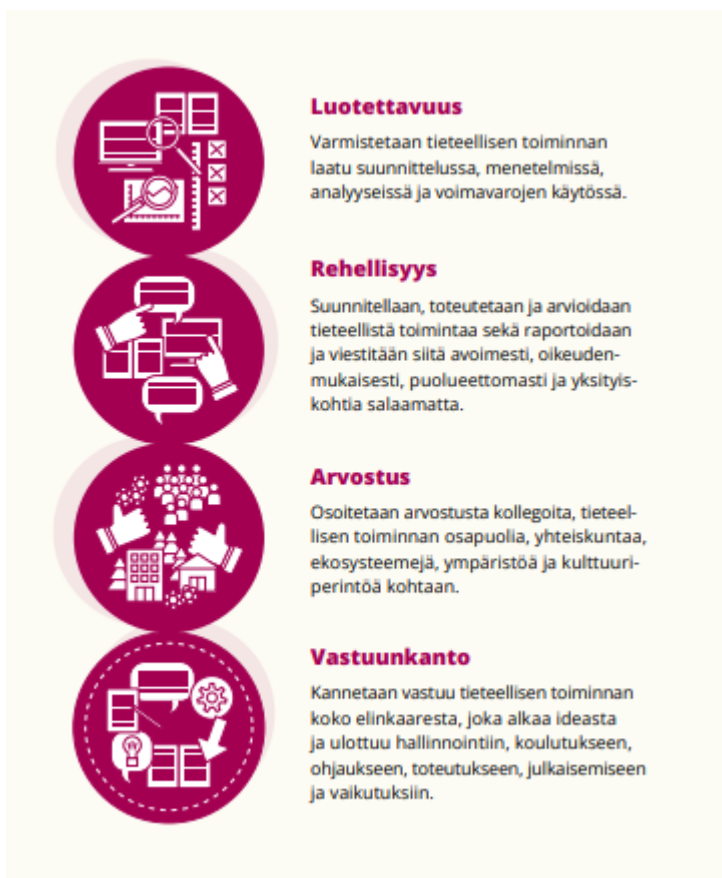
Kuva 2. Eurooppalaisen tutkimuseettisen ohjeistuksen periaatteet. (Tutkimuseettinen neuvottelukunta 2023.)