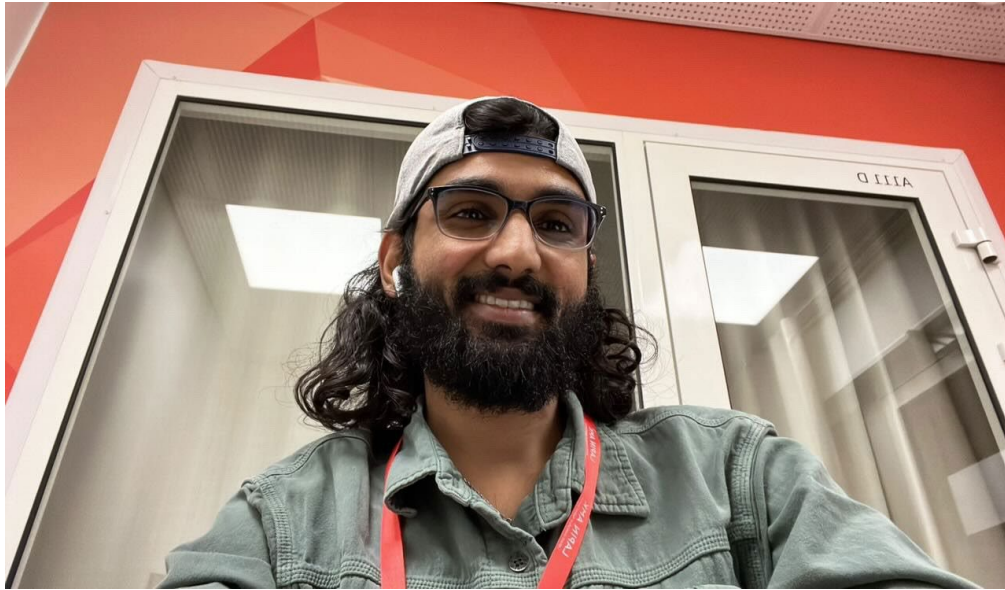
Kuva 2: Dev Patel