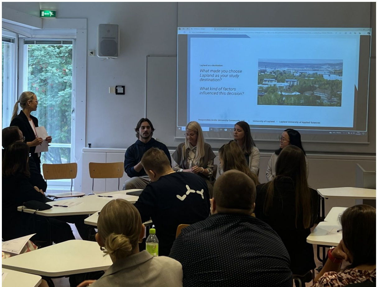
Kuva 1: Kansainvälisten korkeakouluopiskelijoiden pitovoima –tilaisuuden opiskelijaneeli.