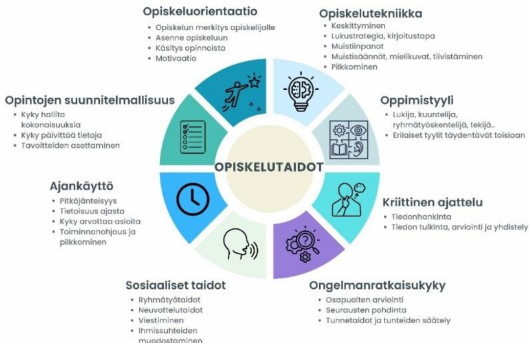
Kuvio 1. Opiskelutaidot on laaja kokonaisuus, johon kuuluu useita osa-alueita. (Kunttu 2021)

Opiskelutaidoilla tarkoitetaan opiskeluun tarvittavia taitoja ja tietoja, joiden avulla opinnot etenevät sujuvasti. Korkeakoulussa opiskelutaidot nähdään osana opiskelukykyä, joka vaikuttaa merkittävästi siihen, kuinka opiskelija suoriutuu opinnoista ja opiskelusta. Yleiset opiskelutaidot edistävät opintojen etenemistä alasta riippumatta. (YTHS 2022; Kunttu 2021.) Opiskelutaitoja on määritelty hieman eri tavoin, joten erilaisia näkökulmia on runsaasti (mm. Korkeamäki 2019; Kunttu 2021; Naqvi, Chikwa, Menon, Kharusi 2018). Yhtä mieltä ollaan siitä, että opiskelutaitoja ovat erilaiset opiskelutekniikat, kuten lukeminen, kirjoittaminen ja laskeminen. Puutteet opiskelutekniikan perustaidoissa aiheuttavat korkeakoulussa opintojen hidastumista ja opintojen stressiä (Pirttimaa, Takala & Ladonlahti 2015; Duraku, Davis & Hamiti 2023; Kunttu 2021). Tähän liittyy korkeakouluopiskelijan metakognitiiviset taidot, eli opiskelijan oma tietoisuus omista taidoista ja ymmärrys omasta oppimisesta. Tämän perusteella opiskelija pystyy valitsemaan itselleen sopivan tavan oppia, eli opiskelustrategiat ja oppimistyylin. Metakognitiivisia taitoja ovat myös suunnitelmallisuus ja ongelmanratkaisukyky. (Ruohontie 2005, Postareff, Hailikari, Virtanen & Lindblom-Ylänne 2021; Korkeamäki 2019.)