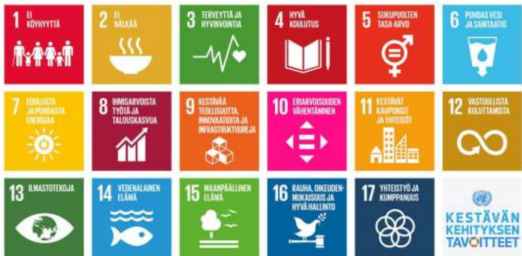
Kuva 1. YK:n kestävän kehityksen tavoitteet vuodelle 2030 (Ulkoministeriö, i.a.).

mennessä (Ulkoministeriö, i.a.). YK:n tavoitteet ohjaavat kansalaisia ottamaan vakavasti yhteiskunnan haasteet. Kestävällä kehityksellä tarkoitetaan jatkuvaa muutosta, jolla pyritään turvaamaan sekä nykyisille, että tuleville sukupolville paremmat elämät. Kestävän kehityksen toimilla pidetään huolta niin ihmisistä kuin ympäristöstä. Kestävän kehityksen toimissa halutaan huomioida maapallon ja sen asukkaiden hyvinvointi kokonaisvaltaisesti. Tällä viitataan muun muassa ekologisiin, sosiaalisiin, taloudellisiin ja kulttuurillisiin lähestymistapoihin. (Ympäristöministeriö, 2023.) YK:n asettamat tavoitteet ovat näin ollen globaalikasvatuksessa huomioon otettavia aiheita. Kuvassa 1 näkyy YK:n asettamat kestävän kehityksen tavoitteet (Ulkoministeriö, i.a.).