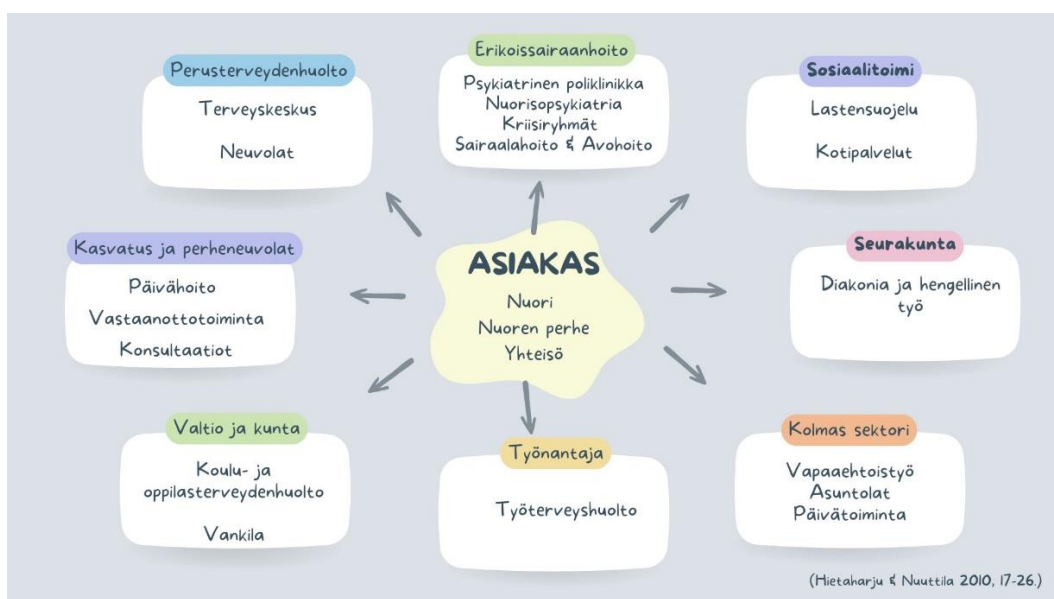
Kuvio 1. Nuoren moniammatillinen tiimi (Hietaharju & Nuutila 2010, 17, muokattu)

Moniammatillisella tiimillä tarkoitetaan eri alojen asiantuntijoista koostuvaa ryhmää, jolla on monenlaista osaamista ja koulutusta. Tiimin jäsenet työskentelevät yhdessä suunnitelmallisesti yhteisten tavoitteiden saavuttamiseksi. He voivat toimia eri toimialoilta, kuten sosiaali- ja terveydenhuollossa, kuntoutuspalveluissa, työllisyydenhoidossa tai järjestöissä. Tiimin pääasiallisena tavoitteena on tukea asiakkaan kuntoutumista mahdollisimman tehokkaasti. (Monialaisen ja moniammatillisen työn johtaminen n.d.) Moniammatillinen yhteistyön tarkoituksena on toimia asiakkaan parhaaksi. Moniammatilliseen tiimiin kuuluu monialaisesti eri toimijoita ja asiantuntijoita. Nuoren kuntoutuksessa moniammatillinen tiimi voi koostua eri tahoilta. (Hietaharju & Nuutila 2010, 17.) Kuvio 1. esittelee esimerkkejä nuoren kanssa työskentelevän moniammatillisen tiimin jäsenistä.