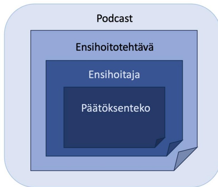
KUVIO 1. Opinnäytetyön keskeiset käsitteet ja niiden yhteys toisiinsa

Tämän opinnäytetyön teoreettinen viitekehys muodostuu neljästä keskeisestä käsitteestä: ensihoitaja, ensihoitotehtävä, päätöksenteko ja podcast. Käsitteet ja niiden yhteys toisiinsa on esitetty kuviossa 1. Kutakin käsitellään tarkemmin seuraavissa alaluvuissa.