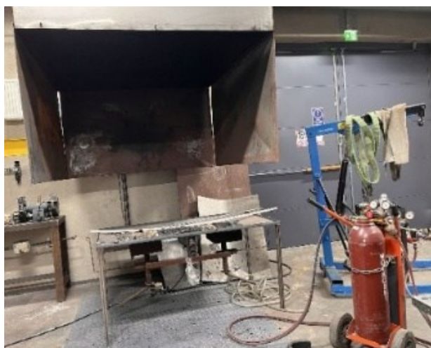
Kuva 4. Turun AMK:n Taideakatemiaan ahjo.

Korostan, että en ole omassa työssäni käyttänyt perinteistä menetelmää, vaan tehnyt yakisugin Turun AMK:n verstaalla olevalla ahjolla (kuva 4), jossa liekki siis muodostetaan kaasua ja happea käyttämällä. Tässä metodissa lämpötila kohoaa jopa lähelle tuhatta astetta. Käsittelyaika oli näin ollen nopea, vain pari minuuttia. Koivulevyt käsittelin vain yhdeltä puolelta, kuten yakisugissa tehdään. Jäähdytymisen ja varovaisen harjaamisen jälkeen levitin pinnoille kaksi kerrosta suojaavaa lakkaa, joka oli Tikkurilan Paneeli-Ässä 10. Lakka säilyttää puun luonnollisena eikä vaikuta sävyyn. Pintaan voisi käyttää myös esimerkiksi jänisliimaseosta, joka olisi luonnollinen koostumukseltaan. Jänisliima on kuitenkin eläinperäistä, ei vegaanista. Polttaminen sai pinnoissa aikaan esteettisesti kiinnostavia sipulimaisia kerrostumia. Tätä ei kuitenkaan tapahtunut tiikkilevyssä, jota käytin yhdessä teoksessa. Siinä vaikutelma oli täysin tasainen ja yhtenäinen. Käytetyllä puulajilla on siis suuri merkitys lopputuloksen kannalta. Yakisugi voisi olla kiinnostava menetelmä myös ulkona sijaitseville taideteoksille, koska se suojaa puun pintaa säätötilojen vaikutuksilta.