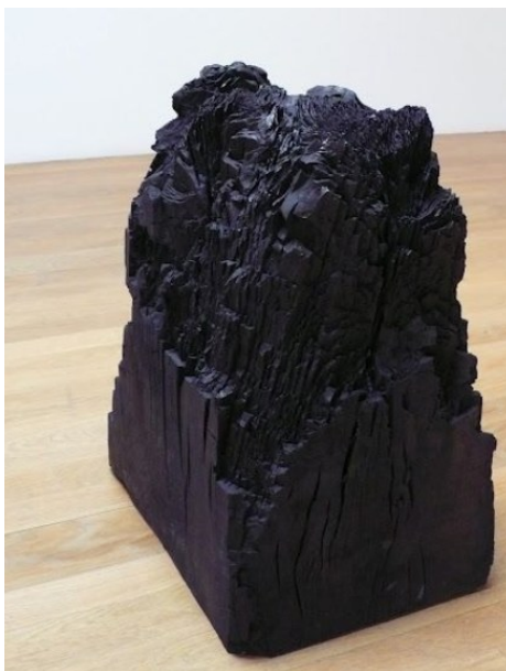
Kuva 6. Narita: Sumi, 1969 (Kuva: Holliday 2012).

Katsuhiko Narita (1944–1992) tuli tunnetuksi erityisesti teoksesta Sumi (1969), jossa hän poltti isoja puukuutioita hiiltyneiksi (kuva 6). Hän pyrki minimoimaan taiteilijan osuutta prosessissa ja painotti puun luonnollista palamisherkkyttä, joka on osa puun materiaalisuutta 'sellaisena kuin se on'. Prosessin luova ja muutosta aikaan saava osuus on tällöin luonnolla, ei taiteilijalla. (Sumi 2003, 37; Rawlings 2009.) Prosessissa ajallinen ulottuvuus oli tärkeä; isojen puumöhkäleiden hiileksi muuttuminen vei pitkän ajan. Se tuntuu painottavan ajallista lopullisuutta, vääjäämätöntä materian tuhoutumista luonnollisen kehityskulun seurauksena. (Minemura 1986, 10; Yoshitake 2013, 207.) Painottaessaan prosessin luonnollisuutta vastakohtana taiteilijan luomiselle hän antaa materiaalin puhua taiteilijan sijaan, mikä oli Mono-han yksi keskeisiä periaatteita.