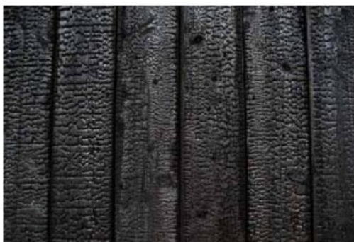
Kuva 2. Yakisugilla käsitelty puun pinta (Miller 2015, 23).

Yakisugia (焼杉板) (kuva 2) kutsutaan joskus myös toisella nimellä shou sugi ban (Miller 2015, 23). Se on vanha, perinteinen japanilainen puun käsittelyn menetelmä, jossa puun pinta käsitellään polttamalla siten, että siihen muodostuu kosteudelta suojaava, hiiltynyt pinta. Japanilaisilla käsityön mestareilla on kullakin omat, tarkoin suojellut reseptinsä yakisugin toteuttamiseen. Yakisugia voidaan myös tehdä nykyaikaisilla menetelmillä kaasun ja hapen synnyttämällä liekillä ahjossa tai kuumilla levyillä. (Kymäläinen ym. 2020, 7.) Esittelen kuitenkin tässä luvussa perinteisen japanilaisen menetelmän pääperiaatteissaan ja kerron havainnoista, joita on tehty yakisugia tutkittaessa. Kiinnostus menetelmää kohtaan on kasvussa sen monien hyvien ominaisuuksien takia. Ilmastonmuutoksen lisätessä säiden ääriolosuhteita yakisugi tarjoaa keinon suojella puupintoja hyvin säiden ja UV-säteilyn kuluttavalta vaikutukselta. Lisäksi menetelmä on luonnonmukainen. Menetelmän avulla saadaan myös esteettisesti miellyttävä pintavaikutelma. Perinteisellä tavalla käsitellyn puun on sanottu säilyvän jopa useita vuosikymmeniä hyvänä ilman lisätoimenpiteitä. (Kymäläinen ym. 2020, 1.)