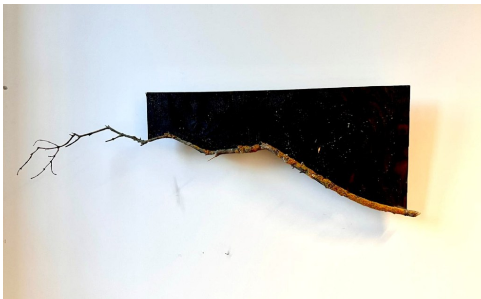
Kuva 7. Sattumanvaraisuuksia 1–9, teos 1.

Oksien etsiminen terävöitti havaintokykyäni. Vielä tänäänkin katson polunvarsia, puita ja puistojen nurmikoita tarkkaavaisin katsein ja huomaan erikoisia pieniä yksityiskohtia, joita en aiemmin olisi pannut merkille. Koin, että etsintäretkilläni ympäristö puhui minulle ja kävi vuoropuhelua kanssani: löytyneet oksat olivat kuin lahjoja, joita minulle suotiin. Näin kohtaamisesta luonnon kanssa tuli teokseni tekemisen ensimmäinen ja tärkein edellytys. Ymmärrän nyt täysin, mitä Kishio Suga ja muut Mono-han taiteilijat tarkoittavat yhteydellä luontoon ja vuoropuhelulla ympäristön kanssa. Havainnot maailmassa olemisesta, eri asioiden välisistä suhteista ja materiaalien syvimmästä olemuksesta edellyttävät luontoon asettautumista ja sen kohtaamista.