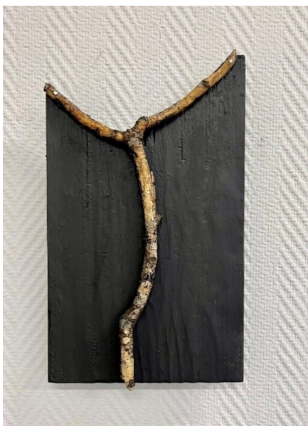
Kuva 8. Sattumanvaraisuuksia 1–9, teos 9.

Materiaalina puu on palamisherkkää. Poltamme puita lämmittääksemme tiloja, saunaa, takkaa. Rakennamme nuotion retkellä valmistaa ruokaa. Luonnossa esiintyy metsäpaloja salamaniskun tai inhimillisen toiminnan seurauksena. Yakisugi , poltettu puu, teossarjassani vie luonnolliseen ja lopulliseen päätökseensä puun kehityskaaren materiaalina ja muistuttaa kaiken lopullisuudesta osana elämän kiertoa. Se on myös wabi , joka pelkistetyimmillään on tyhjän tilan kauneutta. Löydetty oksa itsessään on myös wabi ja sabi , ajan kuluttamaa ja kiertonsa loppupäähän tullutta materiaa. Sen kauneus perustuu rosoisiin, luonnon sanelemiin, käsittelemättömiin muotoihin.