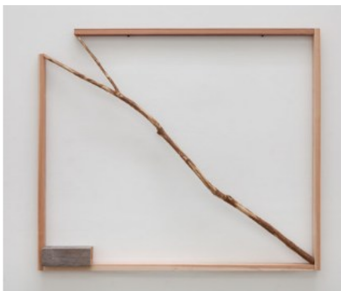
Kuva 5. Kishio Suga teos Opening Situation (1990–2016) (Suga 2025).

Kishio Suga (1944 -) teoksissa minua kiehtoi oivaltava leikillisuus, jolla hän toi esille materiaalien tai objektien yllättäviä yhteyksiä ja suhteita toisiinsa tai ympäristöön asettelemalla niitä kekseliäästi sommitelmiksi (kuva 5). Suga teoksissa on usein tärkeitä suhteita tilaan, etenkin isoissa töissä ja installaatioissa on keskeistä tilallinen sommittelu, jolla hän kiinnittää katsojan huomion ympäristöön ja siihen, miten objektit ja katsoja ovat suhteessa tilaan ja toisiinsa (Bradberry 2024). Objektit ja käytetyt materiaalit ovat usein täysin käsittelemättömiä tai niukasti muokattuja. Suga halusi tuoda esille sen, että kaikki on olemassa suhteessa ympäristöön tai suhteessa johonkin toiseen objektiin, mikä pohjautuu itämaiseen filosofiaan. Negatiivisen tilan ( ma ) käsitteeseen kuuluu kaiken oleminen suhteessa välissä olevaan tilaan eli tavallaan kaikki on jatkumoa. Länsimaisessa ajattelussa taas on korostettu erillisyyttä tai individualistisesti yksilöä. (Sumi 2003, 11.) Sugalle luonto on keskeistä: "How I capture nature and how I place myself within its bounds—that is the first and very critical element of my work" (Suga 2013, 230).