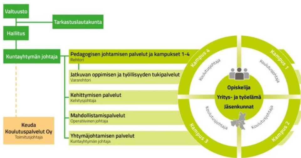
Kuva 1. Keudan organisaatorakenne [Kampukset ja pedagoginen toiminta Keudan organisaatorakenteessa 2024].

voi olla saman kampuksen alla. Kampukset koostuvat tiimeistä.. Kampuksia johtavat koulutusjohtajat ja heidän alaisuudessaan toimivat toimialapäälliköt ja tiimiesihenkilöt (kuva 2). Toimialapäällikkö vastaa oman tiimensä lisäksi toimipisteen toiminnan koordinoinnista sekä nimettyjen tutkintojen Keuda-tasoisesta kehittämisestä. Keudan kymmenellä toimipisteellä on oma toimipistevastaava toimialapäällikkönsä. Toimipisteiden tiimejä vetävät toimialapäälliköt sekä tiimiesihenkilöt. (Kampukset ja pedagoginen toiminta Keudan organisaatorakenteessa 2024.).