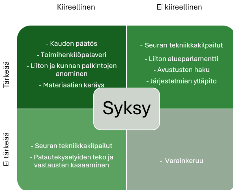
Kuvio 5 Syksyn matriisi

Matriisien avulla priorisoidut tehtävät ovat taulukoitu Excelliin värikoodein, jossa jokaisen tehtävän prosessikuvaus on avattu kuvion 6 mallin mukaisesti.