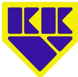
Kuvio 1. KK-V logo, 2022

Pääseuran täyttäessä 100 vuotta, päivitettiin seuran logo nykyiseen muotoonsa. Viralliset seuravärit ovat keltainen ja sininen koko seurassa, jotka näkyvät myös kuviossa 1.