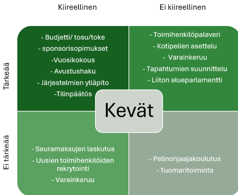
Kuvio 4 Kevään matriisi

kertaan seuran tekniikkakilpailut sekä palautekyselyiden teko ja vastaustulosten kokoaminen. Harmaavihreässä osiossa on varainkeruu, jolla tarkoitetaan joukkueiden ja seuran tekemiä talkootöitä.