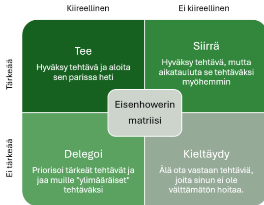
Kuvio 2 Malliesimerkki matriisi

Matriisin käyttö sopii käsillä olevien tehtävien ja toimien aikatauluttamiseen, sekä tulevien tehtävien ja toimenpiteiden jaksottamiseen. Kuviossa 2 on tekijän oma hahmotelma Eisenhowerin matriisista ja sen tarkoituksesta.