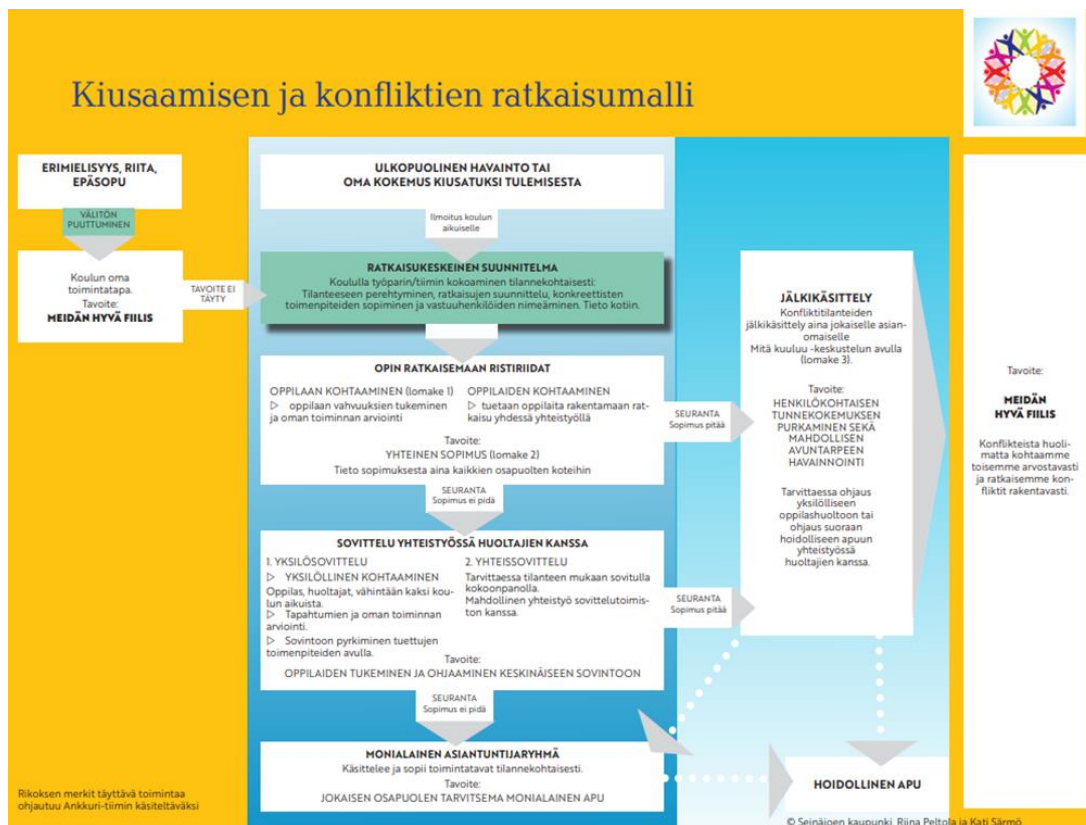
Kuva 2 Yhdessä yhteistyöllä -toimintamalli. (Seinäjoen kaupunki, i.a).

ehkäisemään kiusaamista kirjallisilla toimintamalleilla. Kuvassa 2 on kuvattuna Seinäjoen Kaupungin Yhdessä yhteistyöllä- toimintamalli, joka korostaa turvallisten rutiinien, tunne- ja vuorovaikutustaitojen harjoittelua sekä konfliktien rakentavaa ratkaisua.