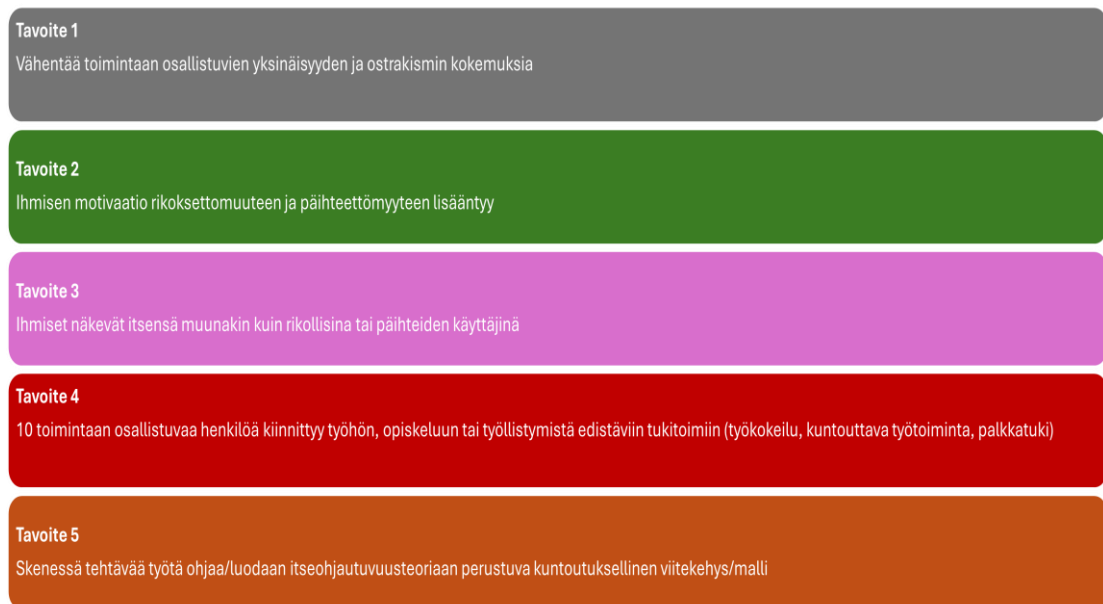
Kuvio 4: Skene ry:n STEA:n hankehakemuksen tavoitteet (mukaillen Skene ry 2023)

Lisäksi tarkasteltiin hankehakemuksessa määriteltyjä tuloksia ja mittareita (kuvio 5). STEA-avustuksen saajan on raportoitava toiminnan tuloksista suhteessa avustushakemuksessa asetettuihin tavoitteisiin, joten myös tuloksia todentavien mittareiden pohtiminen on ollut keskeistä jo avustushakemusta suunniteltaessa (STEA 2025b). Tässä yhteydessä keskusteltiin myös vaikutusketjusta, joka liittyy olennaisesti hankehakemuksessa määriteltyihin tavoitteisiin ja niiden saavuttamiseen. Osallistujat pohtivat, miten Skene ry:n toimet voivat vaikuttaa asiakkaidensa elämään ja kuinka tämä vaikutusketju ilmenee käytännössä. Keskustelussa korostui, että vaikutusketjun ymmärtäminen on keskeisessä roolissa toiminnan tuloksellisuuden osoittamisessa, sillä se auttaa yhdistämään konkreettiset toimet ja niillä saavutetut muutokset asiakkaiden elämässä.