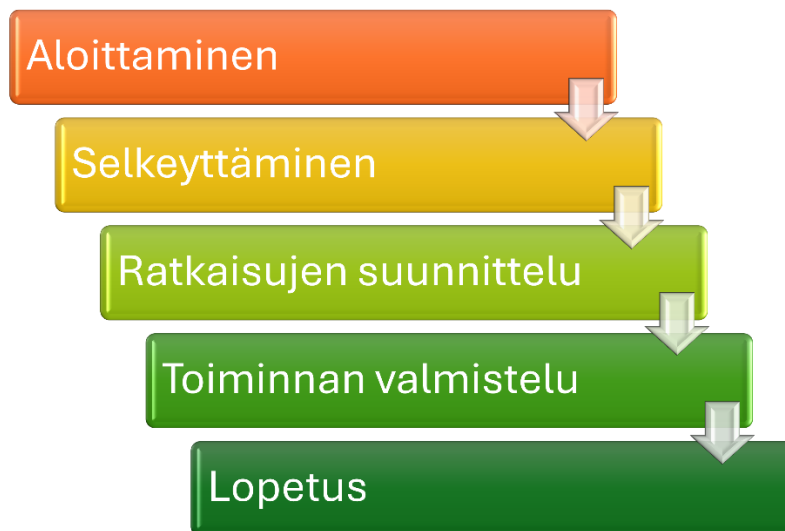
Kuvio 3: Luovan ongelmanratkaisun prosessi (mukaillen Kantojärvi 2012)

Työpaja aloitettiin yhteisellä ruokailulla ja esittäytymiskierroksella, mikä auttoi luomaan rennon ja avoimen ilmapiirin. Vaikka osallistujat tunsivat toisensa ennestään, esittäytymiskierros tarjosi mahdollisuuden opinnäytetyön tekijän esittäytymiseen ja roolin selkeyttämiseen. Työpajan runkona toimi Kantojärven (2012) kuvaama luovan ongelmanratkaisun prosessi, joka koostuu viidestä eri vaiheesta: aloittamisesta, selkeyttämisestä, ratkaisujen suunnittelusta, toiminnan valmistelusta ja lopetuksesta (kuvio 2).