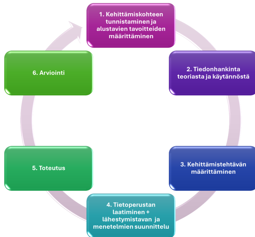
Kuvio 2: Kehittämistyön prosessikuvaus (mukaillen Ojasalo ym. 2015, 24)

suunnitelma toteutetaan käytännössä, ja arviointivaiheessa tarkastellaan työn onnistumista. Arvioinnin tulokset voivat käynnistää uuden kehittämisprosessin. (Ojasalo ym. 2015, 22.)