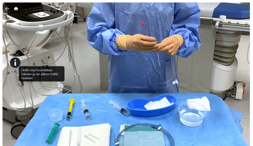
Holkin tagia painamalla opiskelijalle näytetään video holkin valmistelusta.