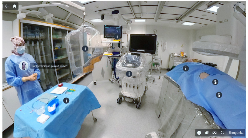
ThingLinkin toisena päänäkymänä toimii angiosalin 360-kuva, josta näkee koko angiosalin ja säätöhuoneen.

Opinnäytetyössä luotiin mahdollisimman käytännönläheinen ja helposti saatavilla oleva oppimateriaali, jossa tieto on tiiviisti koottuna. Angiografia poikkeaa selvästi muista kuvantamismodaliteeteista. Kuvaushuoneessa ollaan säteilyn käytön aikana ja lisäksi toimenpiteissä noudatetaan leikkaussalitoimintaan verrattavissa olevaa aseptiikkaa, joten on tärkeää, että opiskelija omaa hyvät toimintatavat angiosalissa työskentelyyn. Alaraaja-angiografiasta löytyy suomenkielistä aineistoa niukasti, minkä vuoksi opinnäytetyön tuotos on tarpeellinen. Tuotos tulee Turun ammattikorkeakoulun röntgenhoitajakoulutuksen opetuskäyttöön nykyisen oppimateriaalin lisäksi. Opinnäytetyön raportti on luettavissa ammattikorkeakoulujen julkaisuarkeissa Theseuksessa. ○