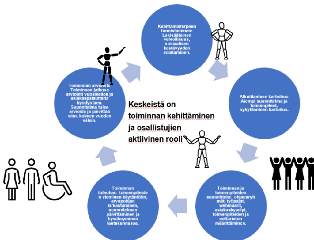
Kuvio 1. Tasa-arvo- ja yhdenvertaisuustyö on syklinen prosessi, missä keskeistä on toiminnan kehittäminen ja osallistujien aktiivinen rooli

Yhteistoiminnallinen oppiminen on osaamisen johtamisen pedagoginen lähestymistapa. Yhteistoiminnallinen ongelmanratkaisu on yksi yhteistoiminnallisen oppimisen menetelmistä. Yhteistoiminnallisen ongelmanratkaisun menetelmässä käytetään hyväksi tiedollisia ristiriitoja ja niiden ratkaisemista väittelyn ja yhteistoiminnan avulla. Sosiaalisen vuorovaikutuksen avulla ohjataan ajatteluprosesseja kohti yhteisymmärrystä. (Hellström ym. 2015, s. 21.). Tavoitteena on prosessoida ja luoda uutta tietoa, jonka tuloksena on oppilaitoksen kulttuurin jatkuva kehittäminen. Yhteistoiminnallisen oppimisen prosessin keskeiset periaatteet ovat (Hellström ym. 2015, s. 24.):