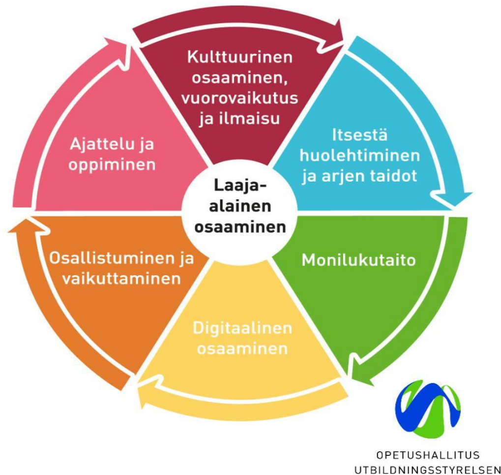
Kuva 1. Laaja-alainen osaaminen varhaiskasvatuksessa (Opetushallitus 2024)

varhaiskasvatuksen järjestäjän tulee laatia paikalliset varhaiskasvatussuunnitelmat. Nämä suunnitelmat ovat jokaiselle velvoittavia sekä niitä tulee kehittää sekä arvioida. (Opetushallitus 2022, 9–11.)