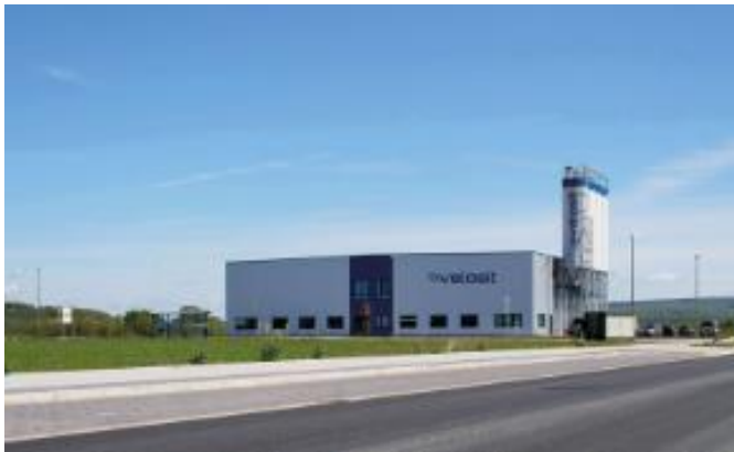
Kuva 6. Velositin tuotantolaitos Saksassa. (14)

Tuotanto alkoi tammikuun alussa 2015 uudessa tuotantolaitoksessa (kuva 6), joka sijaitsee Saksassa Industriepark Lippe -alueella. (14)