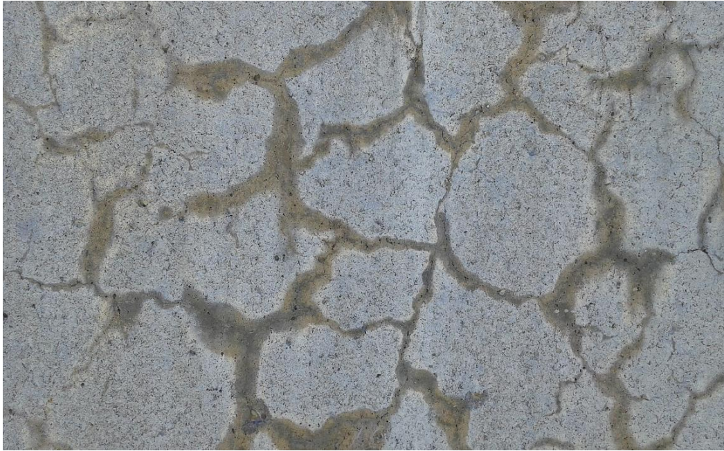
Kuva 4. Alkali-kiviainesreaktio betonissa. (10)