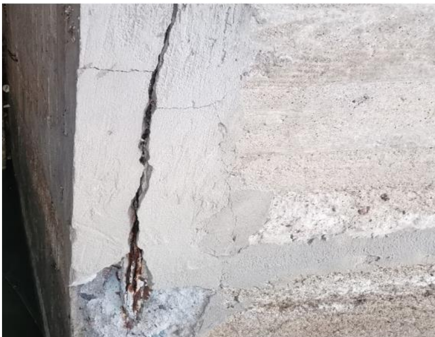
Kuva 3. Pakkasrapautunut julkisivu, jonka raudoituksissa korroosio. (9)