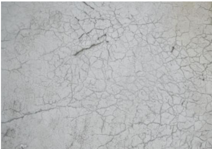
Kuva 2. Pintahalkeillut betonilattia. (8)