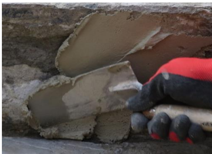
Kuva 5. Laastipaikkauksen, eli korjauslaastin levitys lastalla. (12)

Kaatokorjaus tehdään niin, että rakenteiden yläpintoja uudelleen muotoillaan pinnan päälle tehtävillä tasoite- ja valukerroksilla siten, että pinnalla virtaava vesi ohjautuu haluttuun suuntaan. Pintalattian korjaamisella tarkoitetaan vanhan kantavan rakenteen päälle tehtävän alusrakenteessa kiinni olevan pintalattian uusimista kokonaan, osittain tai uuden pintalattian tekemistä vanhan kantavan rakenteen päälle. (5, s. 558)