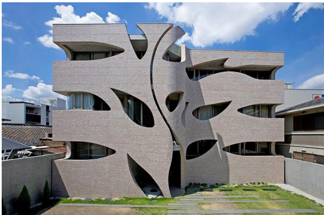
Kuva 1. Villa Saitan, Kieto, Japani. Betonista voidaan rakentaa myös todella erikoisia ja arkkitehtuurisesti mielenkiintoisia rakennuksia, kuten tämä Estern Design Officen vuonna 2006 rakentama huvila. (6)

Betonin laaja käyttö perustuu sen lujuuteen, jäykkyyteen, kosteuden kestoön, turvallisuuteen, muokattavuuteen sekä edulliseen hintaan. (5, s.13).