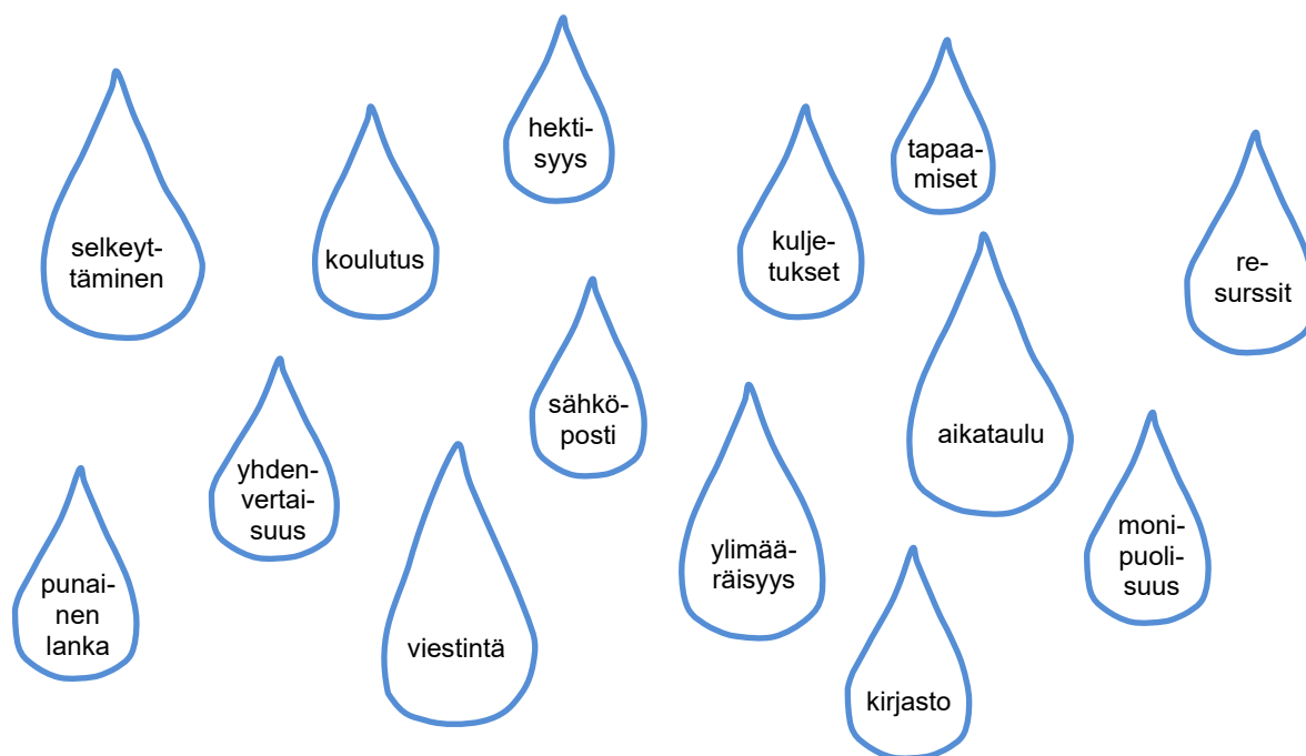
Kuvio3. Sanapilvi aineistossa esiin nousseista avainsanoista

Kehitettävää olisi etenkin Kulttuuripolun ja Lätäkön tiedottamiseen liittyvissä asioissa, varhaiskasvattajien kouluttamisessa sekä Kulttuuripolun käyttöönoton seuraamisessa.