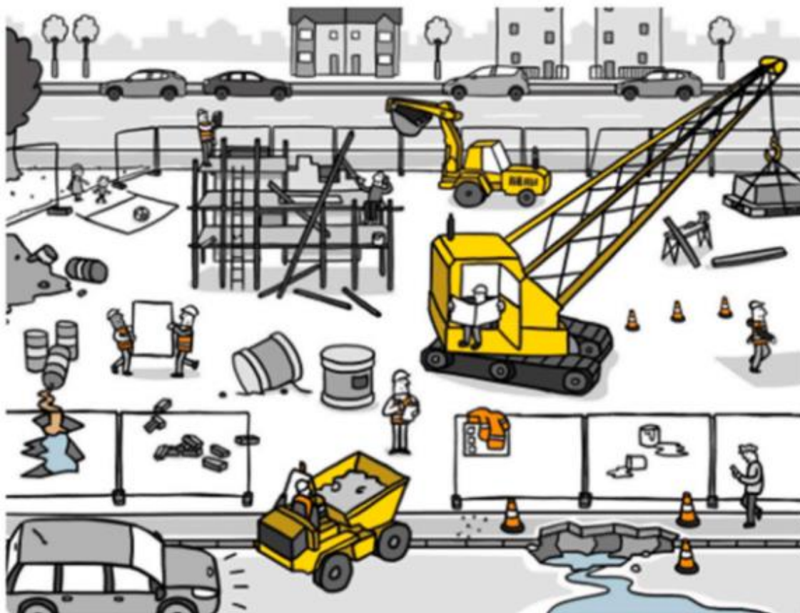
KUVA 5. Rakennustyömaa (Saka ym. 2024, 11).