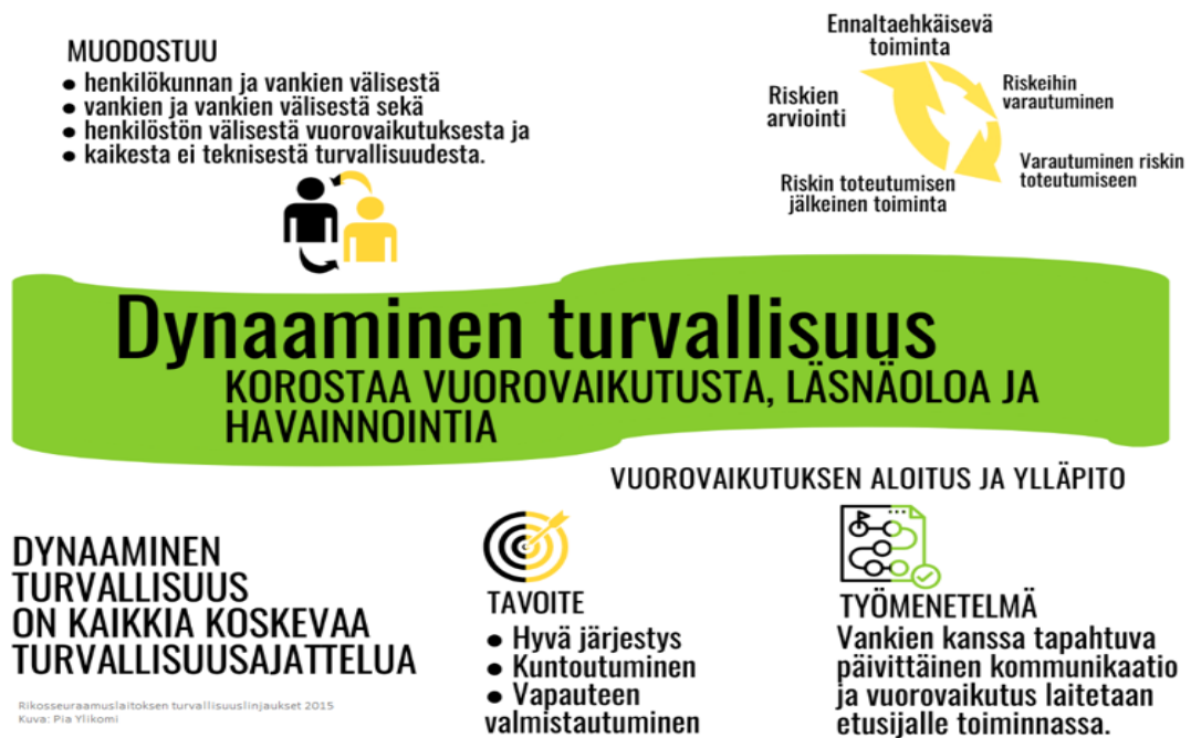
Kuva 3: Dynaaminen turvallisuus. (Ylikomi 2020).