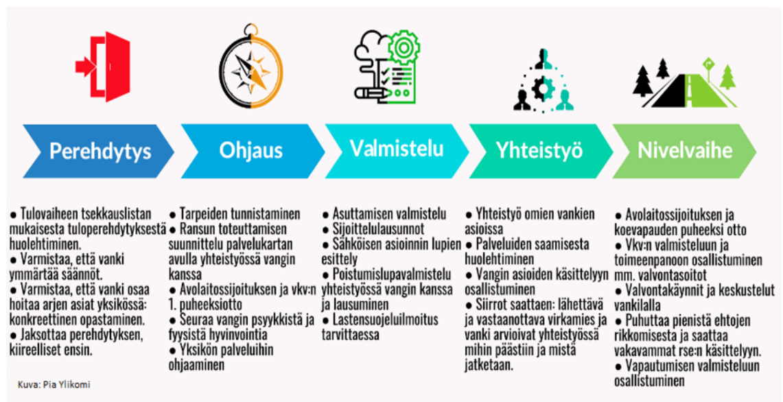
Kuva 5: Rikoksettomaan elämäntapaan valmentaminen. (Ylikomi 2020).