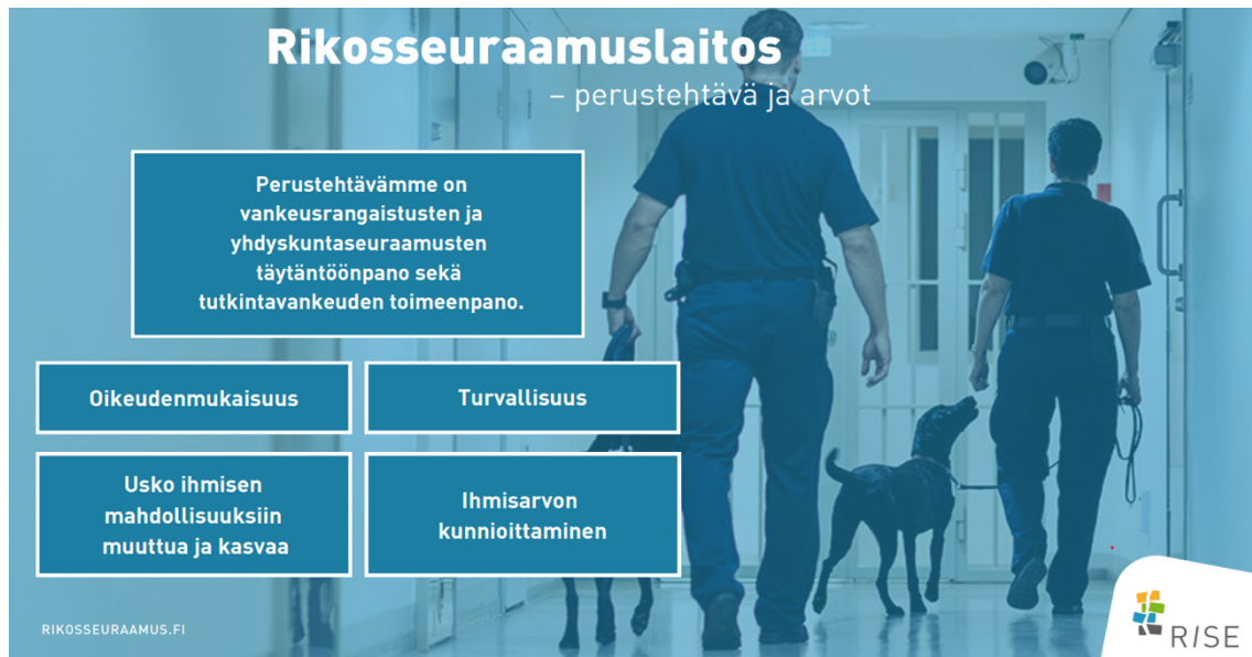
Kuva 2: Rikosseuraamuslaitoksen perustehtävät ja arvot. (Rikosseuraamuslaitos 2024).