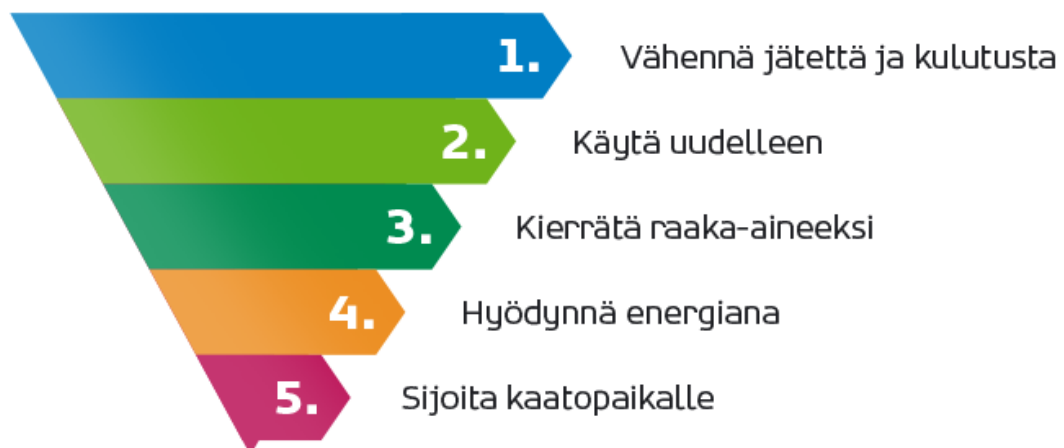
Kuva 3. Etusijajärjestys (10.)

Mikäli mahdollista 8 § mukaan kaikessa toiminnassa on noudatettava kuvan 3 mukaista etusijajärjestystä.