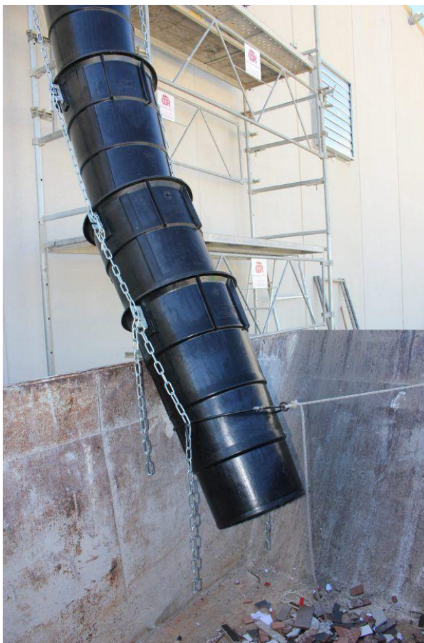
Kuva 7. Roskakuilu (20.)

Kuvan 7 kaltaisia roskakuiluja käytetään rakennusjätteen siirtämiseen kerroksista suoraan jätelavoille.