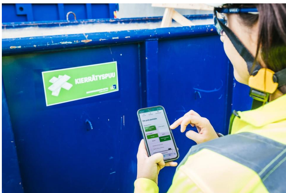
Kuva 5. Vaihtolava merkitty selkeästi (18.)

Perehdytyksessä esitetään työntekijälle ajankohtaiset suunnitelmat, joista ilmenee myös jätteiden käsittelyn kannalta tärkeät asiat. Näitä suunnitelmia ovat aluesuunnitelma ja mahdollinen tarkempi jätesuunnitelma. Suunnitelmista selviää työntekijälle esimerkiksi jäteastioiden paikat ja siirtoreitit. Työryhmille esitetään erikseen työlaji- ja materiaalikohtaiset lajitteluohjeet. Jäteastiat merkitään työmaalla selkeästi jakeittain, esimerkiksi kuvan 5 mukaisesti.