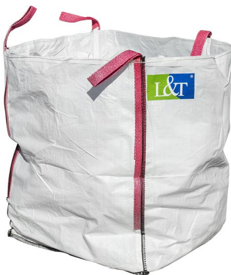
Kuva 8. Suursäkki nostokahvoilla (21.)

Vaihtoehtoisesti perinteisen jätteenastian sijasta voidaan käyttää kertakäyttöisiä kestävästä materiaalista valmistettuja kuvan 8 mukaisia suursäkkejä.