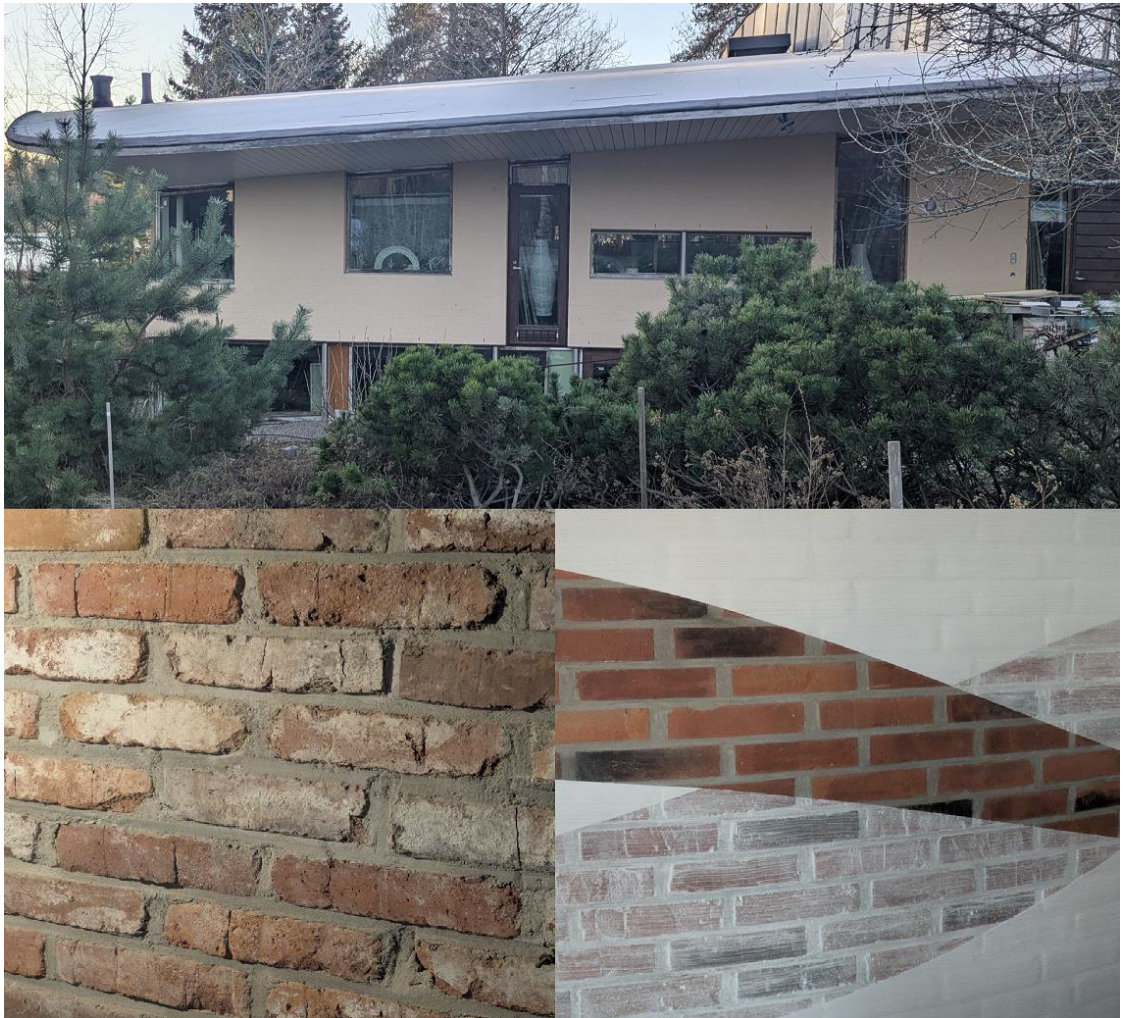
Kuva 1. Uudelleen käytetty tiili omakotitalossa

Hyvänä esimerkkinä rakennusmateriaalin kierrätyksestä uudelleen käytettynä on tiili. Kuvassa 1 tiiltä käytetty kierrätettynä omakotitalossa Espoossa. Täystiilitalon julkisivun tiili on pinnoitettu ja sisällä väliseinissä tiiltä on käytetty pinnoittamattomana sekä eri tavoin pinnoitettuna.