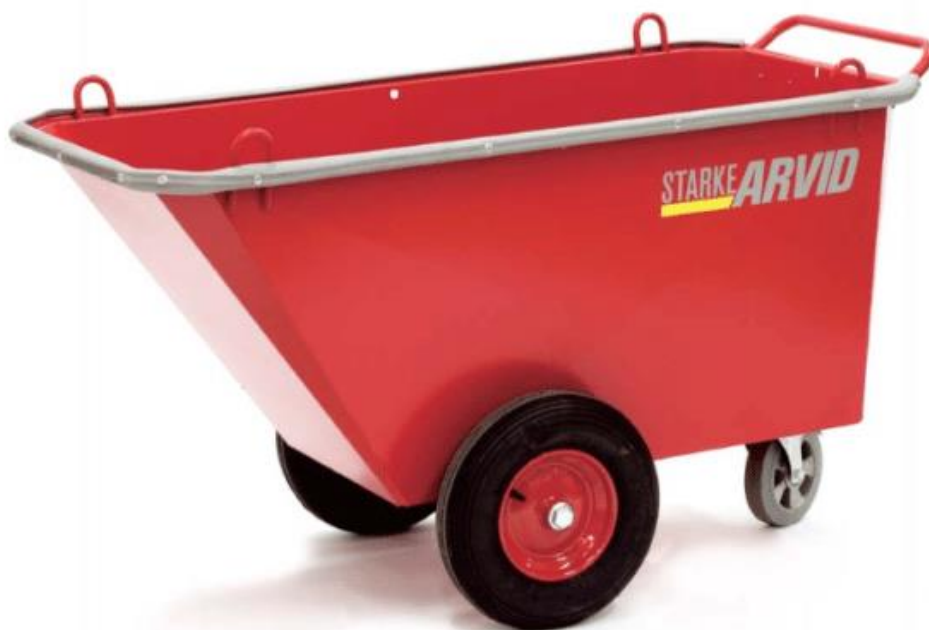
Kuva 6. Työmaavaunu nostosilmukoilla (19.)

Siirtoihin rakennuksen sisällä käytetään pyörällistä jäteastiaa, kottikärryä tai kuvan 6 kaltaista erityistä työmaavaunua, joka on varustettu nostosilmukoilla ja korkeilla laidoilla.