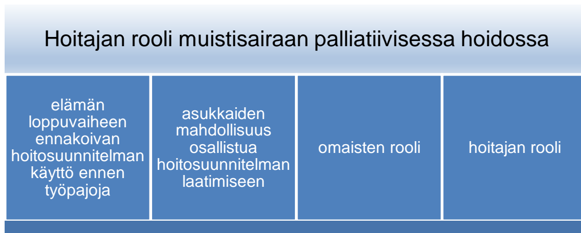
Taulukko 1. Hoitajan rooli muistisairaana palliatiivisessa hoidossa

Elämän loppuvaiheen ennakoiva hoitosuunnitelma ei ollut työpajoihin osallistuneille hoitajille ennestään tuttu eikä se ollut käytössä yhdessäkään yksikössä. Hoitajat kertoivat, että hyvin harvalla muistisairaalla on hoitotahto, tai sen säilytyspaikasta ei välttämättä ole tietoa. Ongelmalliseksi koettiin myös kirjausohjeiden kirjavuus. Hoitajat kokivat, että heillä ei ole yhtenäistä ohjeistusta siitä, mihin asukkaiden hoitoon liittyvät toiveet tulisi kirjata, jotta ne olisivat kaikkien helposti löydettävissä.