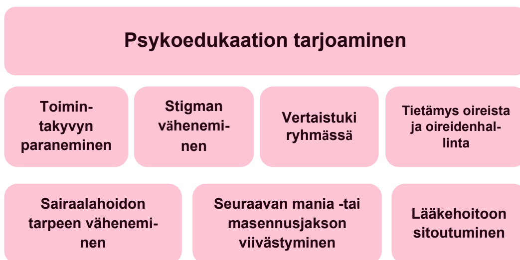
Kuvio 1. Opinnäytetyön tulokset

Pelkistyksen jälkeen muodostui yksi yläluokka: Psykoedukaation tarjoaminen. Koska yläluokkia on vain yksi, niin tulokset on jaoteltu tässä kappaleessa alaluokkiin. Näihin kuuluvat alaluokat: toimintakyvyn paraneminen, stigman väheneminen ja vertaistuki ryhmässä. Lisäksi lääkehoidon sitoutuminen, sairaalahoidon tarpeen väheneminen, tietämys oireista ja oireiden hallinta sekä seuraavan mania- tai masennusjakson viivästyminen (kuvio 1).