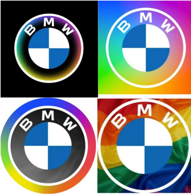
Kuva 3. BMW:n logo sateenkaaren väreissä vuosina 2020-2024 (BMW 2020-2024)

Globaalisti toimiva BMW on tunnettu sen valmistamista autoista sekä moottoripyöristä. Vuonna 2023 yritys oli myynyt reilut 2,55 miljoonaa moottoriajoneuvoa, ja saanut tuottoa 155,5 miljardia euroa. (BMW s.a.). Kyseessä on siis suuri yritys, jonka viestintä koskettaa laajaa sidosryhmää.