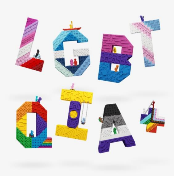
Kuva 7. A-Z of Awesome -kampanjan aakkosia (Lego 1.6.2022)

Lego on osoittanut toiminnallaan johdonmukaista sitoutumista LGBTQ+ -yhteisöä kohti. Konkreettiset teot, jotka näkyvät myös Pride-kuukauden ulkopuolella, ovat mahdollistaneet onnistuneen sateenkaariviestinnän ja suojanneet Legon brändiä pinkkipesu-syytöksiltä. Lisäksi ulkopuolelta tulevat paineet eivät ole ajaneet Legoa vetämään DEI-ohjelmiaan pois, mikä kertoo yrityksen sitoutumisesta monimuotoisuuteen ja inklusiivisuuteen.