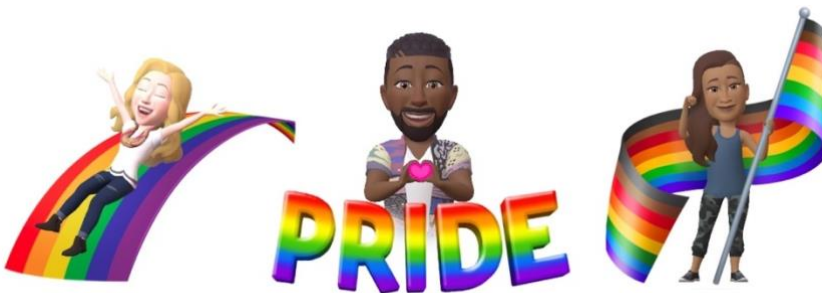
Kuva 2. Esimerkit Facebookissa sekä Messengerissä käytettävistä avatareista (Meta 1.6.2022)

Metan toteuttama viestintä täyttää kriteeristön kaikki kolme kohtaa. Näistä selkein on kohta 3. Yritys näyttäytyy LGBTQ+ -yhteisön tukijana vain silloin, kun se on taloudellisesti kannattavaa. Videot on luotu katsottavaksi Metan kehittämällä Meta Quest VR-laseilla, jotka maksavat useita satoja euroja (Meta s.a).