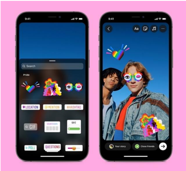
Kuva 1. Instagram-tarinoissa käytettävät tarrat (Meta 1.6.2022)