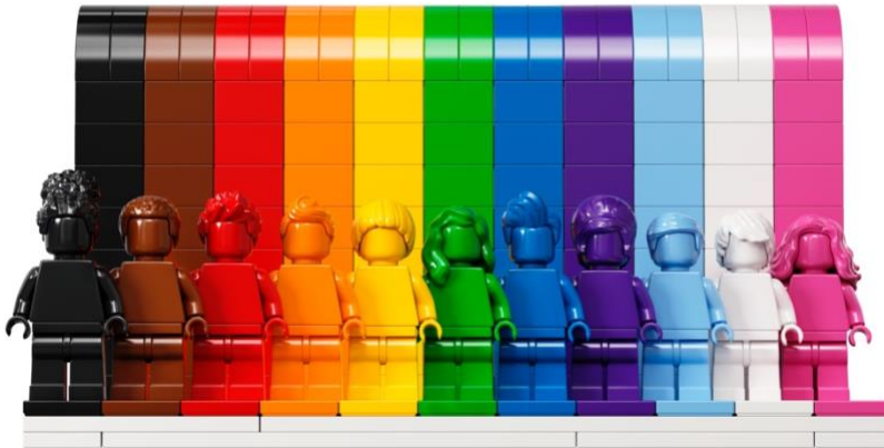
Kuva 6. Everyone is Awesome -legofiguurit (Lego 20.5.2021)