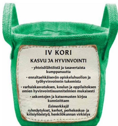
Kuva 1. IV kori, kasvu ja hyvinvointi (Kirkkohallitus s.a.)

Kouluasteiden opetussuunnitelmat ohjaavat yhteistyötä eri uskonnollisten yhteisöiden kanssa. Myös lait perusopetuksesta (21.8.1998/628), lukiosta (10.8.2018), ammatillisesta koulutuksesta (11.8.2017/531) ja oppilas- ja opiskelijahuollosta (30.12.2013/1287) vaikuttavat yhteistyön rakentumiseen. Oppilaiden hyvinvoinnin ja kasvun tukeminen sekä dialogisuuden edistäminen uskontojen välisistä katsomuksista on oppilaitosten ja evankelis-luterilaisen kirkon seurakuntien tekemän yhteistyön tavoitteena. Kirkkohallitus ohjaa tätä työtä, ja se on laatinut tästä eräänlaisen korimallin yhdessä Opetushallituksen kanssa (kuva 1). Korit jakautuvat neljään koriin, jotka sisältävät tavoitteet, sisällöt ja reunaehdot yhteistyölle. Korien sisällöt jakautuvat yleissivistävään opetukseen, perinteisiin juhliin, uskonnollisiin tilaisuuksiin sekä kasvuun ja hyvinvointiin. (Mäkelä 2021, 178–179.)