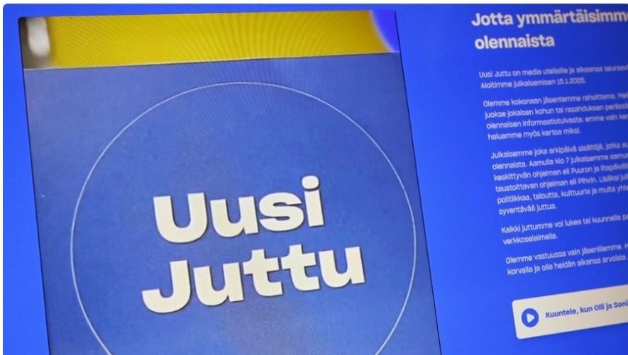
Kuvakaappaus Uuden Jutun verkkosivuilta aloituspäivänä keskiviikkona.