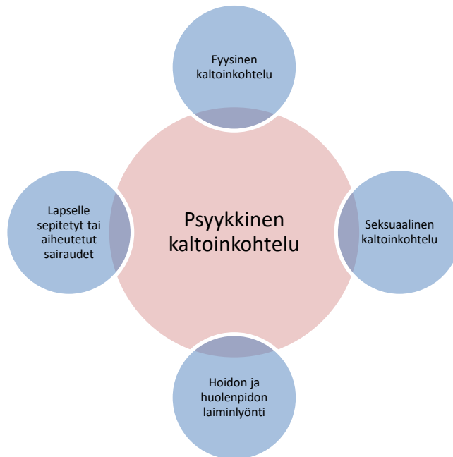
Kuva 1. Kaltoinkohtelun muodot.

On tärkeää huomioida, että väkivallan ilmapiirissä eläminen sekä vanhempien välisen väkivallan näkeminen ovat myös lapsen kaltoinkohtelua. Kaltoinkohtelu voi siis olla myös epäsuoraa, jolloin se kohdistuu lapseen välillisesti. Kaikki kaltoinkohtelun muodot ovat lapselle haitallisia sekä lyhyellä että pitkällä aikavälillä. Kaltoinkohtelu on merkittävin ACE-ilmiöön (Adverse Childhood Experiences) sisältyvä tekijä, joka saa aikaan lapsen elimistöön kroonisen tai toksisen stressitilan. Sen seurauksena lapselle saattaa aiheutua kasvu- ja kehityshäiriöitä, sairauksia ja muutoksia käyttäytymisessä sekä vaikutuksia myös aivojen kehitykseen ja toimintaan. (Hotus-hoitosuositus 2022, 6–7.)