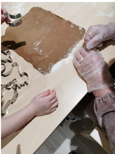
Kuva 1. Piparien leivontaa yhdessä lasten ja vanhusten kanssa.

Aluksi esittelimme itsemme. Kerroimme, että olemme sosionomiopiskelijoita Karelia-ammattikorkeakoulusta ja että tapahtuma liittyi opinnäytetyöhömmme. Pidimme kaikkien kesken nimikierroksen. Olimme jakautuneet pöytiin niin, että lapset ja vanhukset istuivat vierekkäin, jotta he pääsisivät tekemään yhdessä aktiviteetteja. Taustalle laitoimme joulumusiikkia ja aloimme leipomaan pipareita. Tunnelma oli lämmin ja kaikki olivat innostuneita. Ensin kaulitsimme vuorotellen yhdessä taikinaa, lapset kaulitsivat ensin ja vanhukset auttoivat lapsia samalla. Piparien leivonnan yhteydessä lapset ja vanhukset keskustelivat yhdessä joulusta (Kuva 1). Kun piparit saatiin leivottua, virikeohjaaja vei piparit uuniin ja vastasi muutenkin pipareiden paistosta. Pipareiden paistuesssa lapset kävivät juttelemassa ympärillä olevien vanhusten kanssa ja tutkiskelivat hoivakodin ympäristöä. Lapsista huokui uteliaisuus vanhuksia kohtaan ja he halusivat omasta tahdostaan käydä kiertämässä ja juttelemassa vanhusten luona. Olimme positiivisesti yllättyneitä siitä, miten lyhyessä ajassa saimme luotua rennon ilmapiirin.