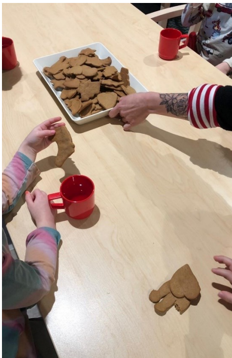
Kuva 2. Mehua ja valmiita pipareita jokaiselle.

pianolla ja muut lauloivat. Lisäksi osaan lauluista kuului ohjattu leikki, johon halukkaat osallistuivat. Lopuksi söimme pipareita, joita myös tarjosimme tapahtumaa seuranneille vanhuksille (Kuva 2). Piparin syönnin lomassa juttelimme lasten kanssa siitä, että olivatko he ennen käyneet hoivakodilla ja miltä tapahtuma heistä tuntui. Tapahtuma päättyi kello 11, kun päiväkodin täytyi lähteä jatkamaan päivää ruokailun merkeissä.