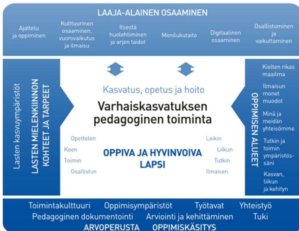
Kuvio 1. Varhaiskasvatuksen pedagogisen toiminnan viitekehys (Varhaiskasvatussuunnitelman perusteet 2022, 38).

Kokonaisvaltaista pedagogista suunnittelua ryhmän opettaja voi helpottaa varhaiskasvatussuunnitelmassa (2022, 38) olevalla kuvalla laaja-alaisesta osaamisesta (Kuvio 1). Kuvassa lähtökohta on varhaiskasvatuksen arvoperusta, jonka ympärille kaikki muu rakentuu. Kuvan tarkoitus on kertoa, että lapsi tarvitsee keskiössä olevia asioista ensin ympärilleen ja tämän jälkeen sitä ruvetaan laajentamaan. Laaja-alaisen osaamisen viitekehyksiä on yhteensä kuusi. Niiden tarkoitus on kehittää lasta niin yksilönä kuin yhteisön jäsenenä. Tätä tukee monipuolinen ja hyvin suunniteltu pedagoginen toiminta. (Opetushallitus 2022, 25.)