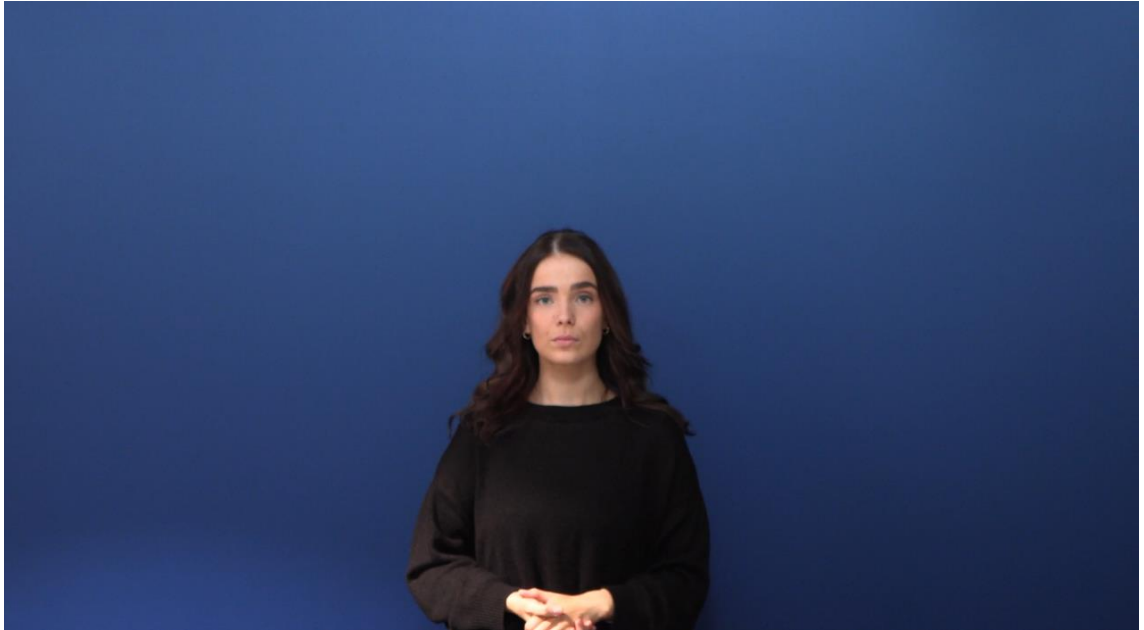
Kuva 1. Tulkkiepiskelija tummissa vaatteissa ja sovitussa kohdassa.