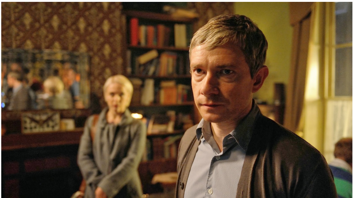
KUVA 7 John Watson ja hänen kihlattunsa Mary Morstan, näyttelijät ovat pariskunta myös siviilissä. (Sherlock 2014)

BBC:n Watson kokee muutoksen sarjan aikana, kulkien post-traumaattisen polvivamman omaavasta sotaveteraanista aina Sherlock Holmesin asuinkumppaniksi, Sherlockin avustajaksi ja ystäväksi. Usein sarjan kerronta siirtyy eteenpäin Watsonin eikä Holmesin kautta, joka on innostunut ratkaisemaan rikoksia hyvinkin erikoisilla tavoilla ja menetelmillä.