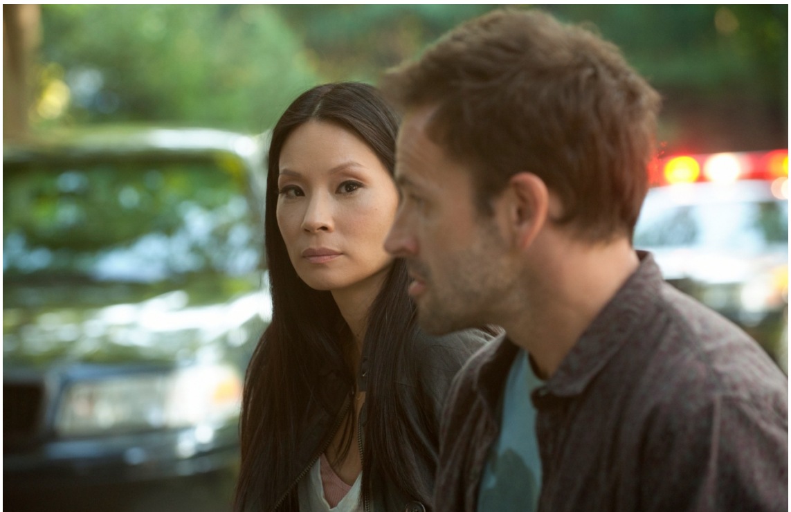
KUVA 6 CBS:n Joan Watson ja Sherlock Holmes. (Elementary 2012)

Joan on Sherlockin opas oikeaan maailmaan. Hän on Sherlockin yhteys humanisuuteen ja Sherlock on kiitollinen Joanille kaikista asioista mitä tämä on opettanut hänelle. Ja Sherlock on sanonut Watsonista, että hän on erityislaatuinen. Jota taas BBC:n Sherlock ei pystyisi ikinä myöntämään kenellekään, ainakaan ääneen.