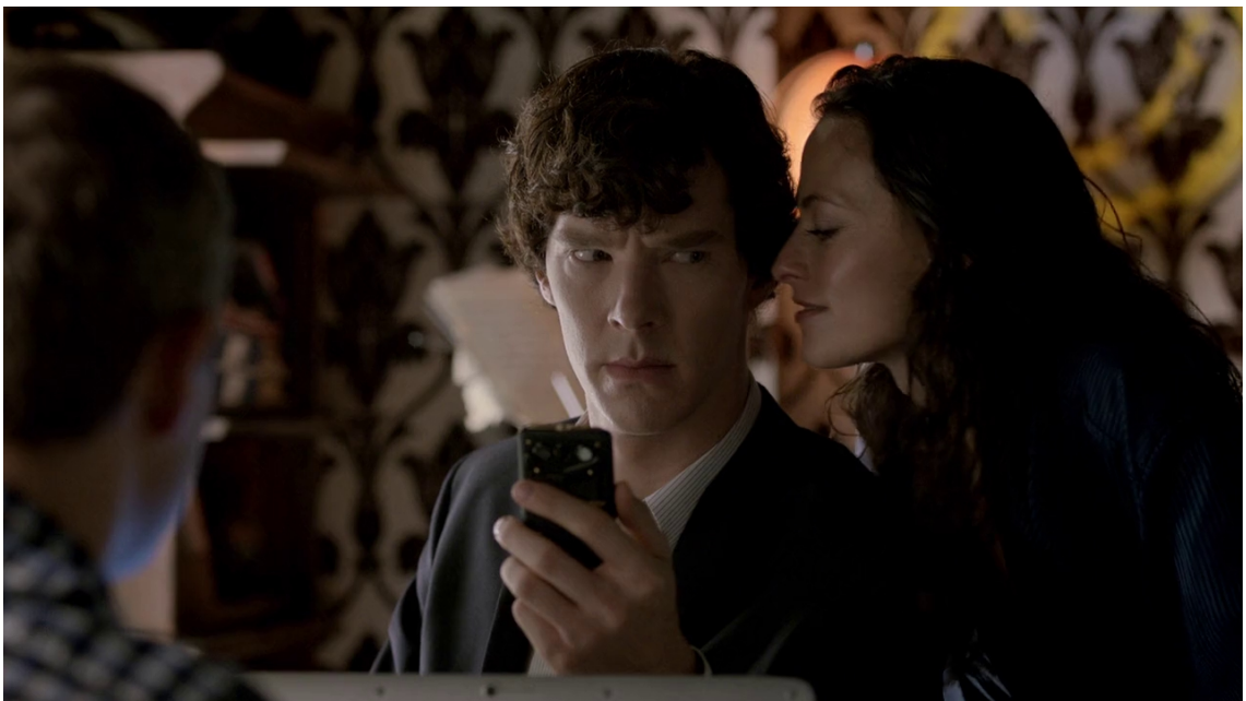
KUVA 8 Irenen kehontoiminta paljastaa hänen olevan rakastunut Sherlock Holmesiin. (Sherlock 2012)

BBC toi Irene Adlerin sarjaansa vasta toisen kauden ensimmäisessä jaksossa, jossa Sherlock tutkii kiristystapausta. Tapauksessa Irene Adler kiristää arvovaltaisia ihmisiä arkaluontoisilla kuvilla, joita hän säilyttää puhelimessaan. Jakso noudattaa paljon alkuperäistä Scandal in Bohemia tarinaa. BBC:n sarjassa Sherlock ei myöskään koskaan myönnä, että hän rakastaa Irene Adleria. Erilaista kuitenkin on, että Irene ei ole amerikkalainen, vaan britti. Eikä hän ole oopperalaulaja, vaan dominatrix, joka tunnetaan paremmin nimellä ”The Woman”.