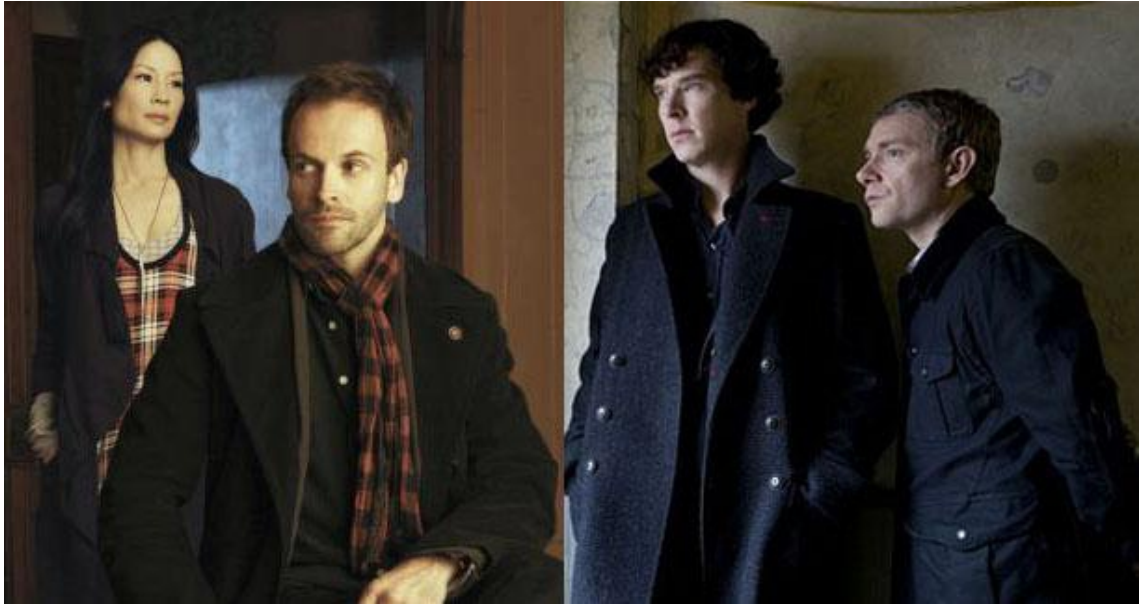
KUVA 3 Kummatkin Sherlock Holmesit omien sarjojensa Watsonien kanssa. (Elementary 2012, Sherlock 2010)

Osaltaan myös tuo oikeudella uhkailu on voinut määrittää hyvin tarkoin, millaisia valintoja Elementaryn tekijät ovat joutuneet tekemään. Mutta tietysti sarjat muistuttavat jollain tasolla toisiaan hyvinkin paljon. Onhan kyseessä kuitenkin sama päähenkilö, Sherlock Holmes, sekä sama aineisto, josta he ammentavat sarjansa.