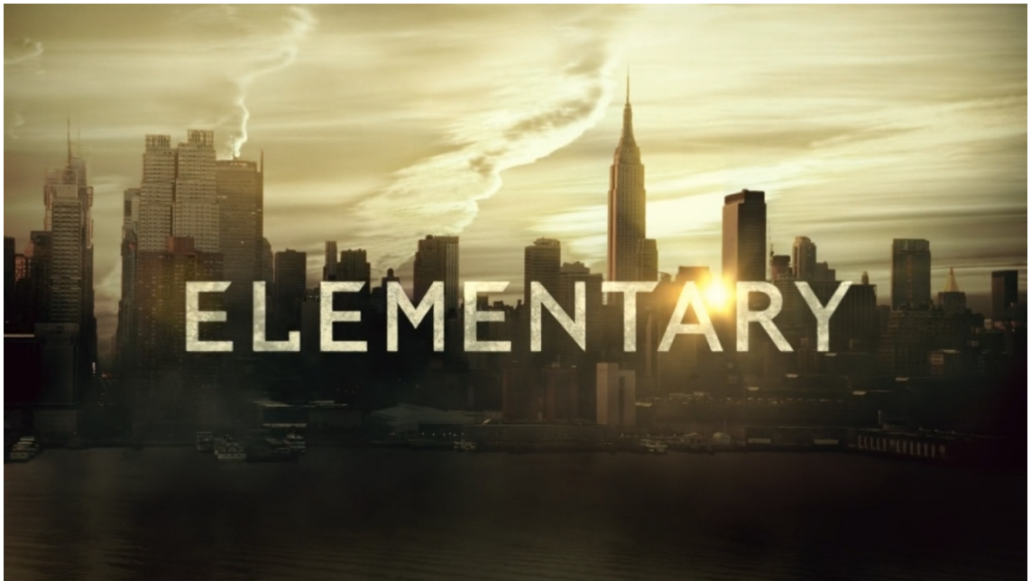
KUVA 1 Elementary-sarjan alkutunnus. Taustalla New Yorkin kaupunki. (Elementary 2012)