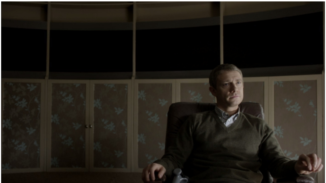
KUVA 15 BBC:n John Watsonin ahdistus näkyy myös kuvasomittelusta. (Sherlock 2010)

BBC:n Sherlockissa tuetaan tarinan kerrontaa kuvin. Kuten jo heti alussa, John Watson istuu terapiassa, hän on ahdistunut ja jopa kuvassa hänet on ahdettu toiseen laitaan, niin että hän katsoo kuvasta ulos.