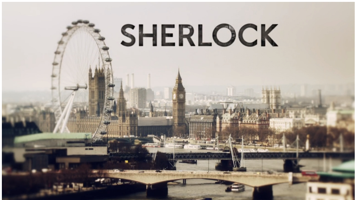
KUVA 2 Sherlock-sarjan alkuunus. Taustalla Lontoon kaupunki. (Sherlock 2010)