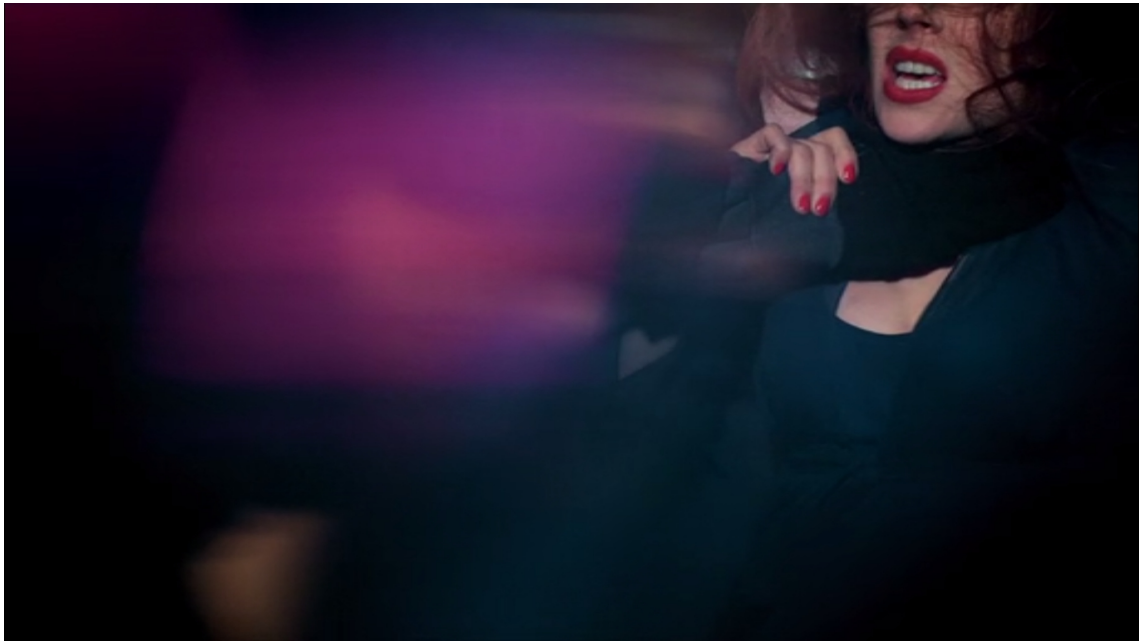
KUVA 14 CBS:n Elementaryn ensimmäisen jakson visuaalinen ilme oli henkeäsalpaava. (Elementary 2012)