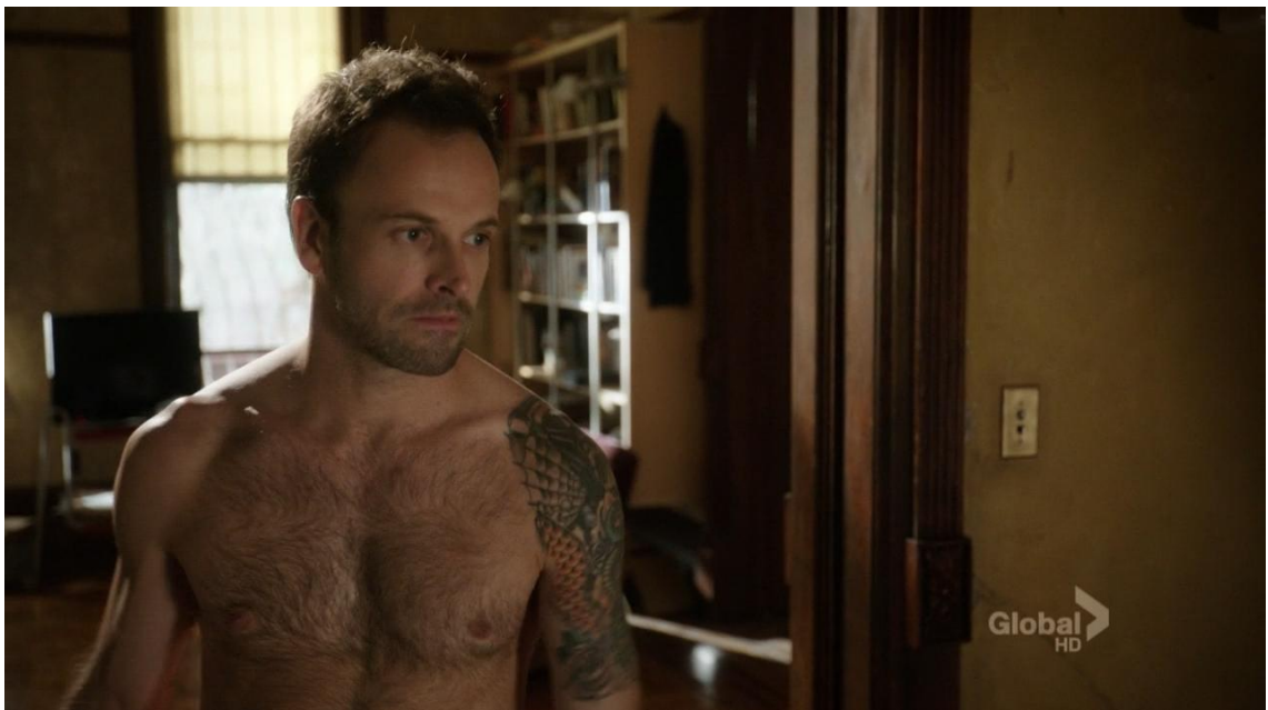
KUVA 4 Jonny Lee Miller tatuoituna Sherlock Holmesina. (Elementary 2012)

Sherlock kuvailee omaavansa tavoitteellisesti erittäin omistautuneen mielen. Lähes joka jaksossa nähdään jokin esimerkki siitä, miten hän kouluttaa mieltään ja henkistä voimaansa. Näiden harjoitusten seurauksena hänen kykynsä ”automatoituvat”. Jo ensimmäisessä jaksossa nähdään tästä esimerkki. Sherlock katsoo seitsemästä televisiosta seitsemää eri ohjelmaa yhtä aikaa ja hän ei pelkästään pyri seuraamaan niitä vaan muistamaan mitä kaikissa ohjelmissa tapahtuu.