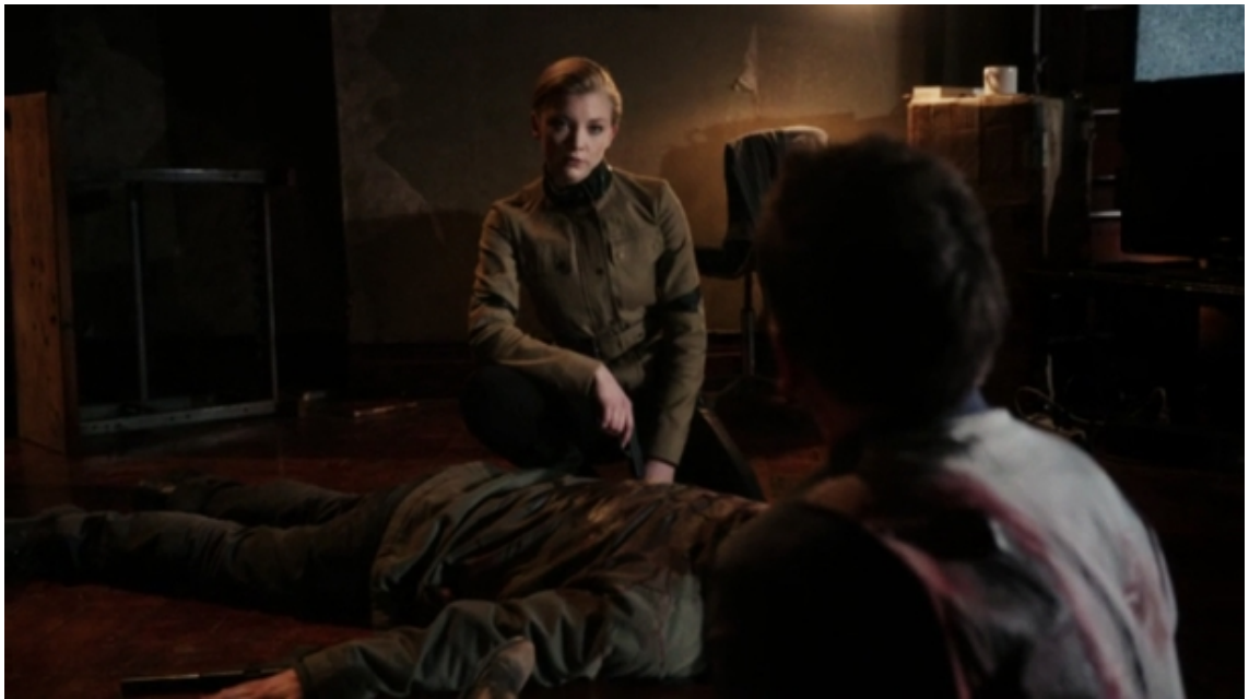
KUVA 9 Irene Adler paljastaa Sherlock Holmesille olevansa Moriarty. (Elementary 2013)