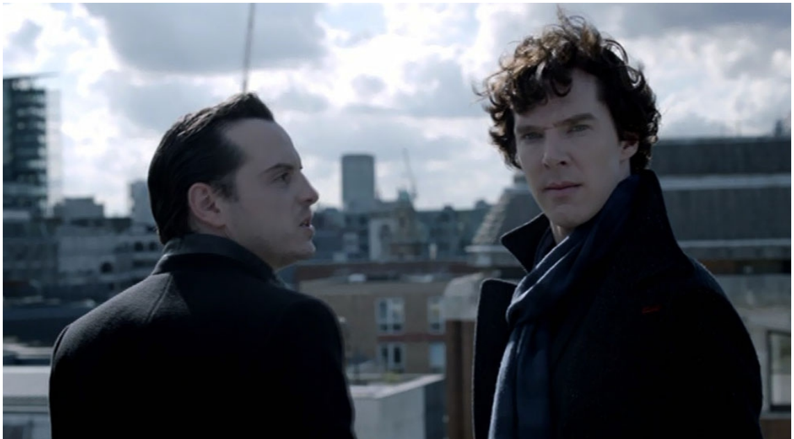
KUVA 5 Sherlock Holmes ja hänen arkkivihollisensa Jim Moriarty sairaalan katolla viimeisessä älyjen taistossa. (Sherlock 2012)