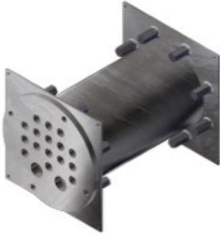
Kuva 6. SJ-150 läpivienti (Temet, LVIS-läpiviennit.)