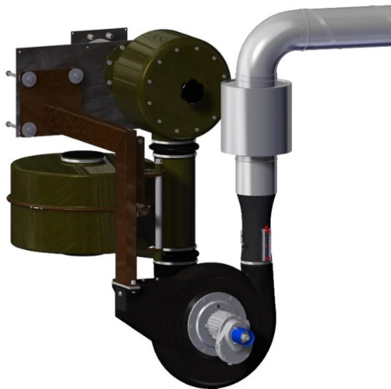
Kuva. 5 Ilmanvaihtolaitteisto IVL-1 (Temet, Ilmanvaihtolaite IVL-1.)

Yleensä ilmanvaihtokoneet ovat kolmivaihemootorilla varustettuja (Kuva 5). Ilmanvaihtolaitteisto sijaitsee useasti lähellä hätäpoistumistietä, ja jos väestönsuoja on kerrostalossa, useasti häkkivarastona toimivassa suojassa ilmanvaihtokone on suunniteltu itse häkin sisään. Ilmanvaihtolaitteistot voivat sijaita myös omassa huoneessaan. Laitteistoille on hyvä suunnitella kaapelireitit. Useasti kaapelit laitteille voidaan vetää valaisinkiskojen mukaan eikä suurempia kaapelihyllyjä väestönsuojoihin tarvitse suunnitella kuin ryhmäkeskuksen yläpuolelle, tämä tulee myös tilaajalle huomattavasti halvemmaksi.