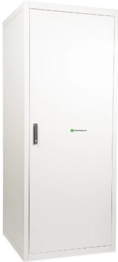
Kuva 3. Laitekaappi (Pistesarjat s.a.)