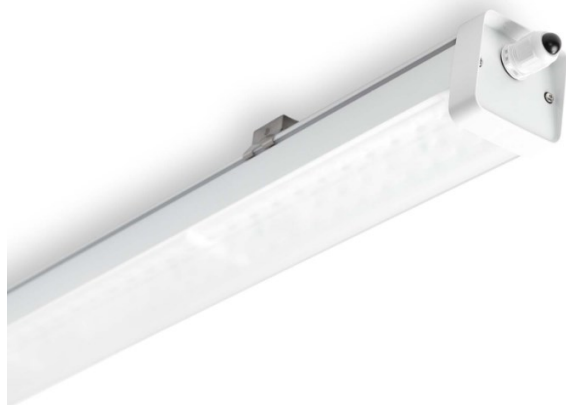
Kuva 2. Runkovalaisin (Ensto Flip s.a.)

Jos normaalioloissa edellytetään enemmän pistorasioita, olisi suositeltavaa suunnitella ne omaksi ryhmäkseen. Pistorasioita suunniteltaessa täytyy suunnittelijan tehdä päätös pistorasian asennustavasta: pinta- tai uppoasennus. Pistorasiat suunnitellaan 16A johdonsuojakatkaisijoiden/vikavirtasuojien taakse, jolloin kaapeloinnissa käytettäisiin MMJ 3x2,5 S johtoa.